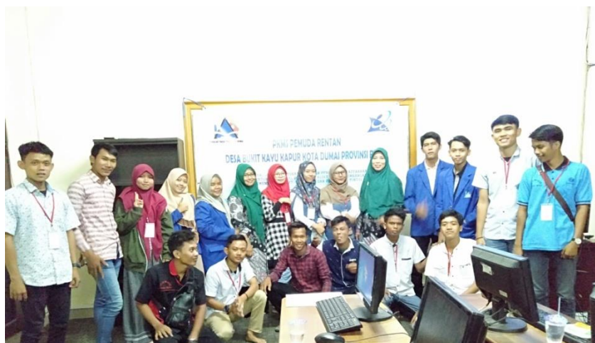
Gambar 3. Peserta pelatihan desain grafis

Partisipasi mitra yaitu kelompok Pemuda Rentan "Laksamana" ditunjukkan dengan adanya dukungan dan kesanggupan untuk bekerjasama sebagai mitra dengan Tim pengusul dari Sekolah Tinggi Teknologi Dumai dalam penerapan Program Kemitraan Masyarakat. Partisipasi mitra ini juga ditunjukkan melalui pelaksanaan kegiatan secara bersama-sama dalam hal kesediaan mengikuti pelatihan di lokasi pelatihan yang telah disepakati gambar 4 menunjukkan partisipasi dan kesungguhan mitra sebagai peserta.