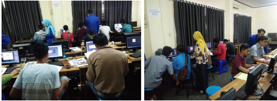
Gambar 4. Kegiatan pelatihan

Gambar berikut ini menunjukkan pelatihan yang dilaksanakan dapat meningkatkan pengetahuan dan keterampilan para peserta pelatihan dalam menggunakan Aplikasi Desain Grafis, peserta dapat mendesain brosur, spanduk, kartu nama dan undangan, serta beberapa produk lainnya. Hal ini tentunya sangat membantu para peserta yang merupakan pemuda rentan, memiliki bekal untuk membuka peluang usaha (Buchari, 2010).