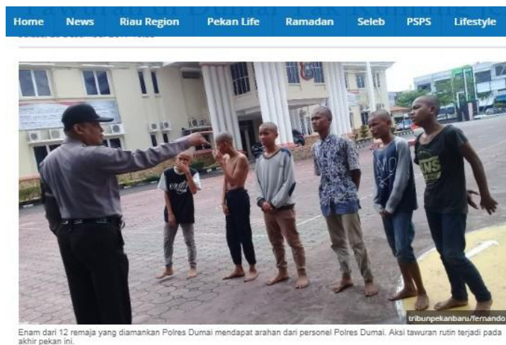
Gambar 1. Pemuda yang terlibat tauran diamankan Polres Dumai

Anak putus sekolah merupakan pemuda rentan (Sutopo, 2014) yang biasanya menghabiskan hari-hari mereka dengan nongkrong di pinggir jalan atau di persimpangan jalan serta di Pos Ronda, Pada kondisi ini, anak putus sekolah menjadi rentan untuk terlibat pada kasus-kasus kriminalitas akibat pengaruh kekuatan yang tidak baik dalam lingkungan sosialnya, seperti resiko pemakaian obat terlarang, kekerasan atau kegiatan seksual yang tidak aman, pemuda rentan yaitu pemuda yang mudah terkena pengaruh negatif dari luar yang karena satu dan lain hal. Hal ini terlihat dari masih didapati kasus-kasus pemuda rentan yang melakukan berbagai tindak kriminalitas yang intensitasnya masih tergolong sering. Pada situs Pekanbaru Tribun (2017) sejumlah pemuda yang terlibat tauran di kota Dumai tak kunjung jera, ada dari pemuda tersebut sudah dua kali berurusan dengan polisi. Mereka tetap terlibat aksi yang meresahkan masyarakat. Berikut gambar cuplikan beritanya.