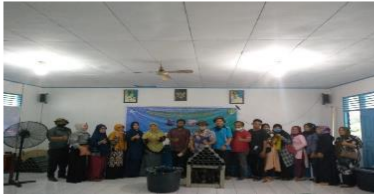
Gambar 2. Sosialisasi sertifikasi halal di Kelurahan Kampung Baru

Adapun hasil positif dari pelaksanaan kegiatan pengabdian ini adalah: pertama) kegiatan pengabdian kepada masyarakat ini dapat menambah pengetahuan dan pemahaman masyarakat Kampung Baru mengenai pentingnya sertifikasi halal, sehingga pelaku usaha dapat mengurus sertifikasi halal pada produk olahannya. kedua) kegiatan pengabdian kepada masyarakat ini mendapatkan respon yang positif dari masyarakat dan aparat pemerintah kelurahan, sehingga mereka berharap kegiatan pelaksanaan pengabdian kepada masyarakat ini dapat dilaksanakan lagi kedepannya.