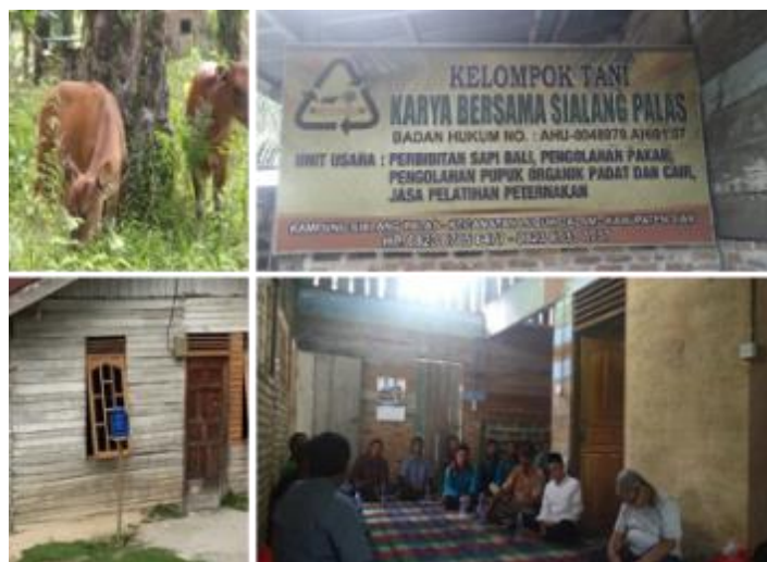
Gambar 3. Lokasi Kegiatan Pengabdian

Dalam mengakhiri kegiatan pengabdian ini dilakukan evaluasi. Setelah kegiatan pengabdian berjalan, dilakukan evaluasi dengan tujuan ingin mengetahui dan menganalisis permasalahan yang muncul antara upaya pencapaian tujuan yang sudah dirumuskan dan kenyataan praktik kegiatan yang berlangsung. Kesenjangan yang dijumpai akan menjadi permasalahan kegiatan pengabdian masyarakat yang akan dicari pemecahannya pada tahun berikutnya. Indikator keberhasilan kegiatan pengabdian kepada masyarakat ini bertumpu kepada;(1) kehadiran khalayak sasaran dalam setiap tahapan kegiatan,rata-rata (80%);(2) jumlah khalayak sasaran yang menginginkan kembali kegiatan ini kembali dilaksanakan,sekitar(95%); (3) pengetahuan dan keterampilan dalam membuat keputusan (80%), pengetahuan umum kesehatan dan memanfaatkan limbah sawit (85%).