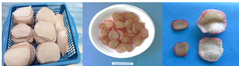
Gambar 2. Kerupuk sagu fungsional ikan biang

Faktor sensoris rasa menentukan keberhasilan varian baru terhadap produksi kerupuk sagu fungsional dengan fortifikasi tepung ikan biang 2% dengan rasa khas, gurih dan enak. Daya kembang kerupuk memberikan pengaruh terhadap tingkat kerenyahan pada produk, sehingga daya kembang yang tinggi produk menjadi lebih renyah dan rapuh untuk dimakan, seiring dengan tingkat higrokopositas produk.