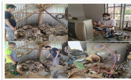
Gambar 1. Foto Mitra Karang Taruna Desa Batulappa

Pengelolaan limbah elektronik belum disadari masyarakat secara menyeluruh karena kurangnya sosialisasi dari pemerintah. Hal ini juga terjadi di Desa Batulappa, Kecamatan Patimpeng, Kabupaten Bone, Provinsi Sulawesi Selatan. Beberapa kelompok pekerja service di Desa Batulappa biasanya menerima konsumen sebesar ± 10 orang per bulan yang datang untuk memperbaiki alat elektroniknya, dimana alat elektronik tersebut menghasilkan ± 5 kg limbah. Dampak yang sangat mencolok adalah umumnya pemilik service elektronik hanya membakar limbah elektronik yang dihasilkan. Hal ini dapat mencemari udara dan ekosistem lingkungan, sehingga diperlukan sebuah upaya dalam mengatasi dan mereduksi limbah elektronik untuk di edukasi kepada Kelompok Karang Taruna Desa Batulappa dengan pemberdayaan limbah elektronik untuk pemanfaatan dan pengolahan E-Waste menjadi lebih ekonomis (Gambar 1 dan Gambar 2).