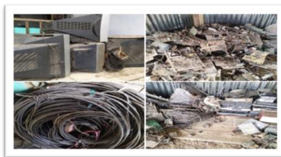
Gambar 2. Penumpukan Limbah Elektronik ( E-Waste )

Kegiatan program kreatifitas mahasiswa ini akan memfokuskan pada pemberdayaan masyarakat melalui peningkatan keterampilan yang ada di sekitar masyarakat (Asfar dkk. , 2021; Asfar, Widiastini & Rahman, 2019; Yasser dkk. , 2020) dengan pengolahan limbah elektronik ( E-Waste ) mix resin sebagai embrio usaha berbasis seni estetika yang merupakan Kelompok Karang Taruna Desa Batulappa sebagai mitra. Pengolahan limbah elektronik ( E-Waste ) jika dilakukan dengan baik serta kreativitas akan membuat sebuah kerajinan