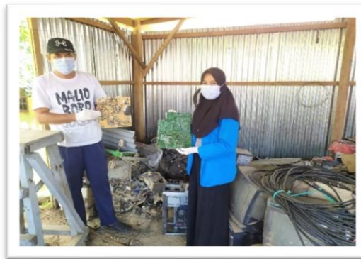
Gambar 6. Pelatihan serta Pemilahan Komponen E-Waste

Tahap pelatihan dilakukan secara luring, kegiatan yang akan dilakukan sebelum pembuatan meja hias dari E-Waste , tim dan mitra bekerja sama untuk menyiapkan alat dan bahan yang akan digunakan.