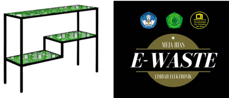
Gambar 7. Rancangan Produk dan Label Produk

Pendampingan dilaksanakan untuk mengevaluasi kemampuan mitra dalam membuat sekaligus kemampuan mitra yang akan dilaksanakan pada tahap evaluasi adalah diskusi mengenai kendala secara luring dengan tetap mematuhi protokol kesehatan, serta pengembangan pemasaran sebagai pelatihan tambahan dilakukan secara online .