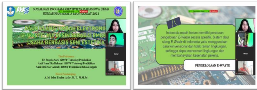
Gambar 5. Kegiatan Sosialisasi secara Daring mengenai Pemanfaatan Limbah Elektronik ( E-Waste )