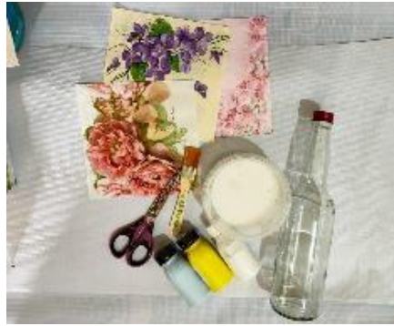
Gambar 3. Peralatan yang Dibutuhkan untuk Membuat Kreasi Decoupage

Pada sesi latihan, peserta mulai mempraktikkan cara pembuatan kreasi kerajinan tangan ini dengan menggunakan bahan dan alat yang disediakan oleh Tim Abdimas. Peserta mengikuti sesi ini dengan antusias (Gambar 3). Ada banyak pertanyaan yang diajukan oleh para peserta. Setiap peserta membuat produk kreasi decoupage sendiri. Mereka dapat mengikuti langkah-langkah pembuatan kreasi decoupage yang telah didemonstrasikan sebelumnya.