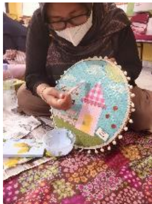
Gambar 2. Pembicara Mendemonstrasikan Cara Membuat Kreasi Decoupage

Pada tahapan ceramah atau memberikan pengetahuan tentang teknik pembuatan decoupage dengan tujuan untuk meningkatkan skill dan menambah pengetahuan bagi para peserta pelatihan. Para peserta diberikan presentasi dengan presentasi sehingga dapat lebih mudah memahami secara audiovisual tentang informasi yang disampaikan (Gambar 2). Dalam sesi presentasi ini, pembicara juga menjelaskan tentang pengetahuan dan keterampilan kewirausahaan melalui ide menciptakan produk dengan kreasi decoupage yang memiliki berbagai manfaat seperti meningkatkan kreativitas dan membuka peluang usaha.