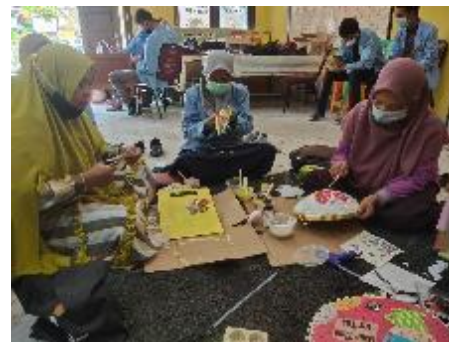
Gambar 4. Peserta Mempraktikkan Langsung Kreasi Decoupage

Ketika kreasi mereka telah selesai, mereka merasa cukup bangga dan puas dengan hasil karya yang dihasilkan (Gambar 5). Para peserta merasa pelatihan ini sangat bermanfaat terutama bagi keterampilan membuat kerajinan tangan. Pelatihan ini dinilai dapat menambah pengetahuan dan keterampilan bagi masyarakat khususnya ibu rumah tangga yang memiliki cukup banyak waktu luang.