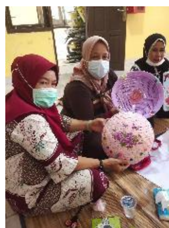
Gambar 5. Hasil Kreasi Decoupage Peserta Pelatihan

Peningkatan wawasan dan keterampilan peserta kegiatan dapat dilihat dari gambar 6 berikut yang diperoleh dari perbandingan nilai pre-test dan post-test berikut: