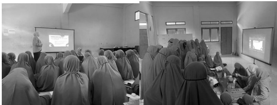
Gambar 2. Penyampaian materi dan demonstrasi proses pembuatan sabun cair berbahan daun sirih

Pelaksanaan kegiatan ini dilakukan pada tanggal 6 Agustus 2022. Kegiatan pertama yang dilakukan adalah penyuluhan. Tim pengabdian menjelaskan materi sabun cair dari daun sirih melalui slide serta memperkenalkan alat dan bahan-bahan yang akan digunakan dalam proses pembuatan sabun cuci tangan cair. Kemudian dilanjutkan dengan menonton video proses pembuatan sabun cair yang telah dipersiapkan oleh tim pengabdian. Pemaparan materi yang disampaikan juga mencakup pentingnya menjaga kebersihan tubuh termasuk mencuci tangan dengan benar. Selanjutnya tim pengabdian kepada masyarakat mempraktekkan proses pembuatan sabun cair berbahan daun sirih (Gambar 2). Jadi kegiatan ini juga berupaya meningkatkan kesadaran mitra untuk tetap hidup sehat pasca pandemi Covid-19.