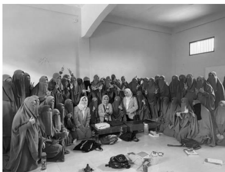
Gambar 3. Penyerahan produk sabun kepada para santri

Hasil dari pelatihan pembuatan sabun tangan cair ini berupa sabun cuci tangan cair berwarna hijau, berbau harum jeruk nipis, tidak membuat tangan kasar sehingga lembut di tangan apabila sabun cuci tangan cair ini dipakai. Selain digunakan untuk keperluan sehari-hari, sabun cuci tangan cair ini juga dapat dijadikan peluang usaha industri rumahan untuk siswa-siswa maupun ibu rumah tangga di Kampung Sungai Masjid (Gambar 3).