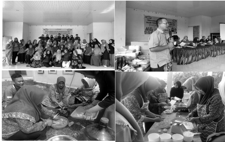
Gambar 1. Kegiatan pelatihan dan peningkatan keterampilan kelompok IRT Nelayan