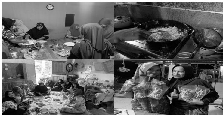
Gambar 2. Kegiatan pendampingan dan monitoring kelompok IRT Nelayan

Kegiatan pendampingan kelompok, monitoring dan evaluasi dilakukan setelah dilakukan kegiatan pelatihan dan peningkatan kompetensi kepada kelompok IRT Nelayan. Dalam kegiatan ini, Tim PKM melakukan kunjungan secara berkala yang dibantu oleh mahasiswa KKN Terintegrasi UNRI. Kegiatan pendampingan dilakukan melalui 2 cara yaitu komunikasi melalui Whatsapp Grup ataupun jaringan langsung (telepon seluler) dan kunjungan langsung ke Desa Buruk Bakul.