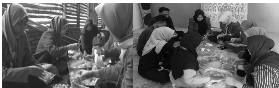
Gambar 3. Kemasan produk keripik singkong

Setelah melalui beberapa tahap, dari mulai pengupasan singkong, penggorengan tahapan berikutnya yaitu pengemasan. Dalam proses ini setelah penggorengan tunggu 5-10 menit ditiriskan agar minyak tidak terlalu banyak tertinggal. Dalam hal pengemasan juga jangan langsung dimasukkan ke dalam kemasan setelah proses penggorengan, hal ini nantinya akan mengakibatkan keripik bisa bau tengik dan tidak tahan lama. Seiring dengan perkembangan jaman serta pola hidup konsumen, persaingan di dunia usaha mikro kecil dan menengah (UMKM), masyarakat menginginkan makanan yang dihasilkan itu bersih, higienis dan rasanya sesuai dengan apa yang diharapkan konsumen (Hidayatulloh et.al., 2022).