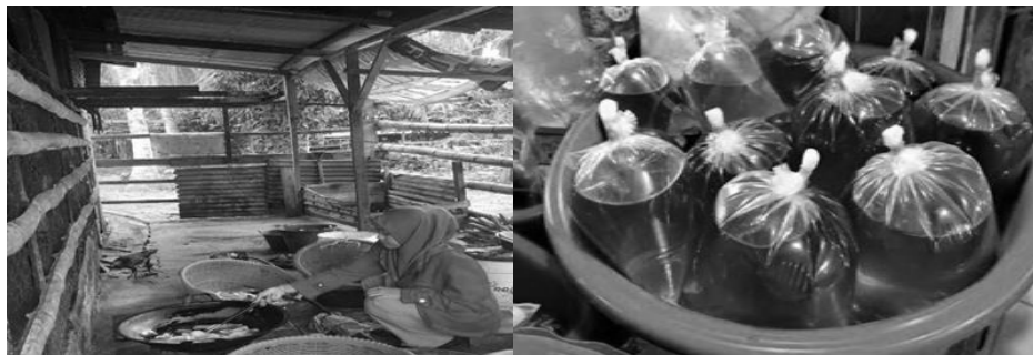
Gambar 2. Proses penggorengan singkong