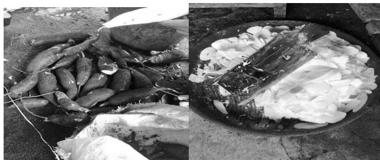
Gambar 1. Proses pengumpulan bahan baku singkong