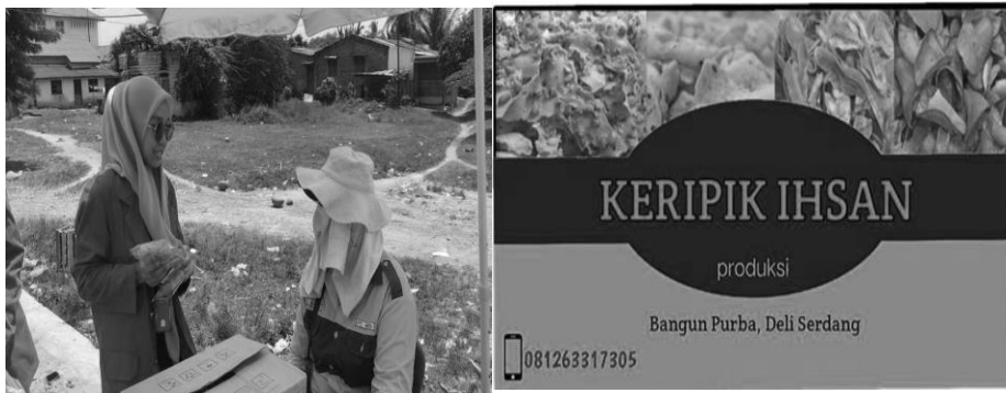
Gambar 4. Metode promosi dan pemasaran

media digital dalam penyampaian informasi pada khalayak ramai (Furqon et.al, 2022). Desain kemasan produk yang menarik akan dapat meningkatkan penjualan produk yang dihasilkan (Gunawan et.al., 2022). Pada mulanya warga Desa Bangun Purba memproduksi keripik singkong sebanyak 500 bungkus per hari, dengan adanya desain baru dan meningkatnya permintaan akan keripik singkong, warga masyarakat Desa Bangun Purba menambah produksi keripik singkong menjadi 800 bungkus per hari. Adapun harga jual keripik dengan ukuran kecil Rp 2.000 per bungkus, ukuran sedang Rp 5.000 per bungkus dan ada ukuran yang agak besar Rp 10.000 per bungkus. Pemasaran keripik singkong dilakukan dengan memasukkan ke warung-warung yang ada di sekitaran Desa Bangun Purba, melalui whatsapp, facebook dan reseller (penjual kembali).