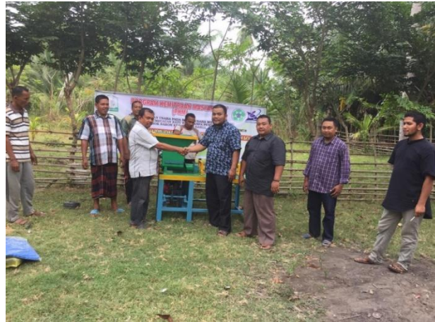
Gambar 7. Serah terima alat yang di wakili sekretaris desa