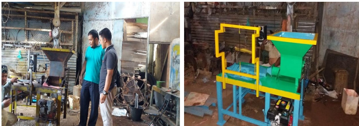
Gambar 2. alat pencampur dan pencetak batu bata