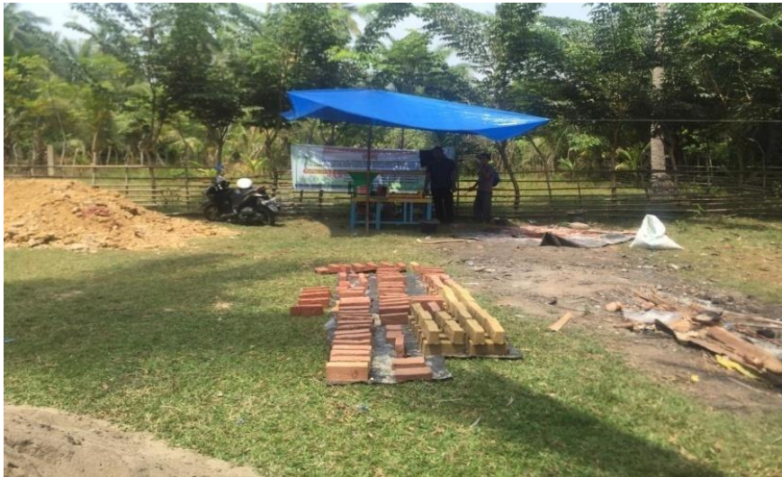
Gambar 3. batu bata tanpa pembakaran setelah di cetak

b. Produk bata tanpa bakar dengan dimensi (220x110x55) mm