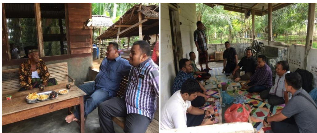
Gambar 6. Rembuk bersama geuchik dan pengurus BUMG

Kegiatan ini dilakukan saat awal sebelum pelaksanaan dimulai dengan diskusi dengan geuchik gampong seuneubok Baroh dilanjutkan dengan ramah amah dengan pengurus BUMG dan perangkat desa