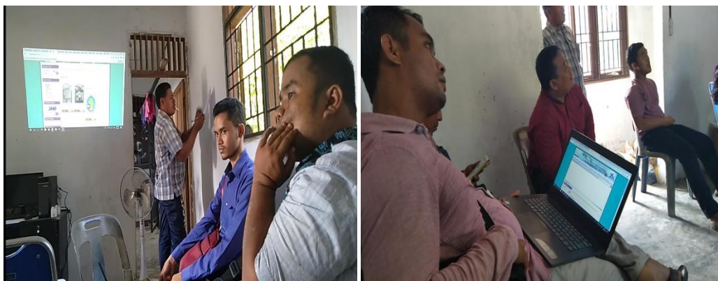
Gambar 9. pelatihan dan pendampingan pengolahan website e-commerce dan aplikasi keuangan di kantor kheuchik Seuneubok Baroh

Pelatihan e commerce an aplikasi keuangan dilakukan di kantor geuchik seunabok baroh dimana dihadiri perangkat desa dan pengurus BUMG. Dalam hal ini tim pengabdian melatih admin perwakilan dari gampong untuk mengelola website dan aplikasi keuangan. Ditunjuk operator dan bendahara desa yang dijadikan admin.