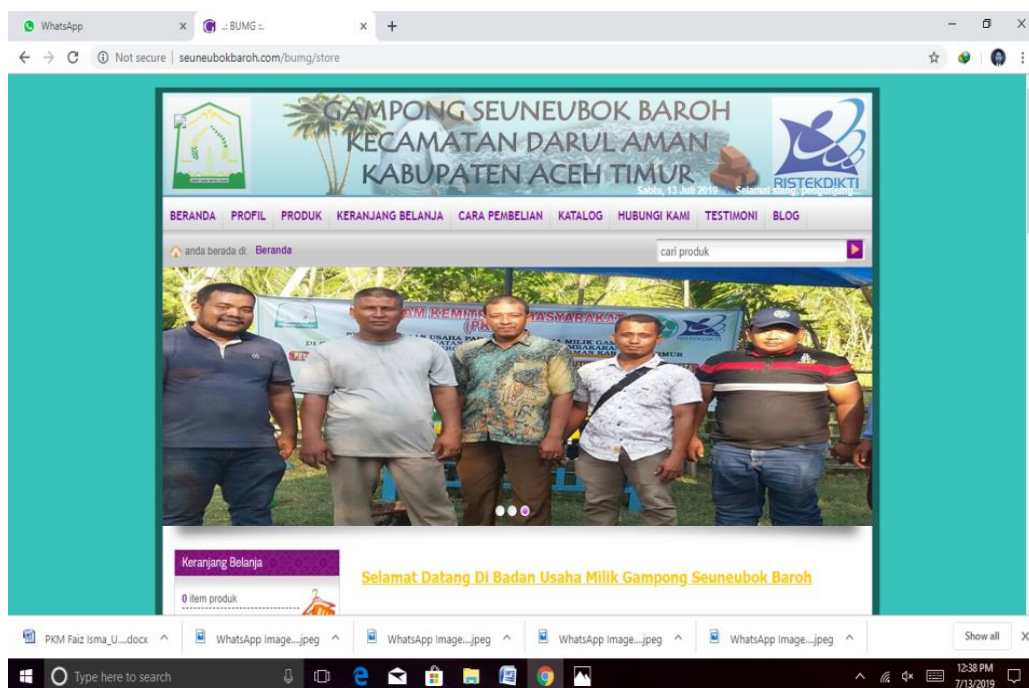
Gambar 4. Tampilan e-commerce BUMG

c. e-commerce berbasis website dengan alamat http://seuneubokbaroh.com/