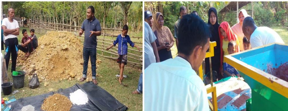
Gambar 8. Pelatihan dan pendampingan pembuatan bata tanpa pembakaran

Setelah alat diberikan dilanjutkan kegiatan produksi batu bata yang dimulai dengan penjelasan teknis oleh ketua PKM dan dilanjutkan tahap pencampuran dan pencetakan batu bata. Antusias warga terlihat dari banyaknyapeserta yang hadir sampai ibu-ibu dan anak-anak datang.