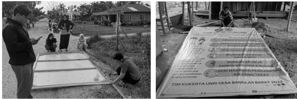
Gambar 4. Pembuatan dan Pemasangan Banner tentang Dampak dan Pencegahan Stunting di Pusat Desa Banglas Barat