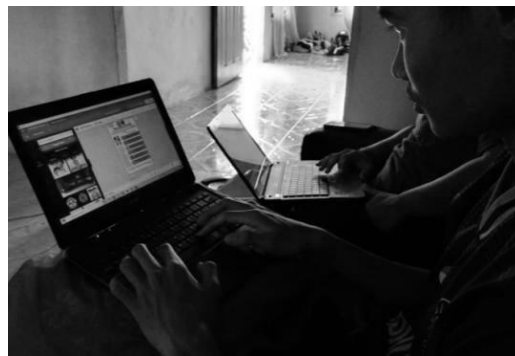
Gambar 1. Pembuatan Desain Banner dan Brosur