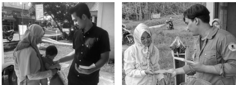
Gambar 3. Pemberian Brosur tentang Dampak dan Pencegahan Stunting kepada Masyarakat Desa Banglas Barat

Kegiatan selanjutnya adalah pemberian brosur kepada masyarakat bersama dengan pelaksanaan kegiatan posyandu yang ada di desa. Kegiatan diikuti dengan pemasangan banner dilakukan di pusat desa, dengan tujuan semua masyarakat yang melintasi jalan tersebut dapat melihat dan membaca banner tersebut. Ukuran banner tersebut adalah 200 X 300 meter dengan desain dan warna yang menarik untuk dibaca.