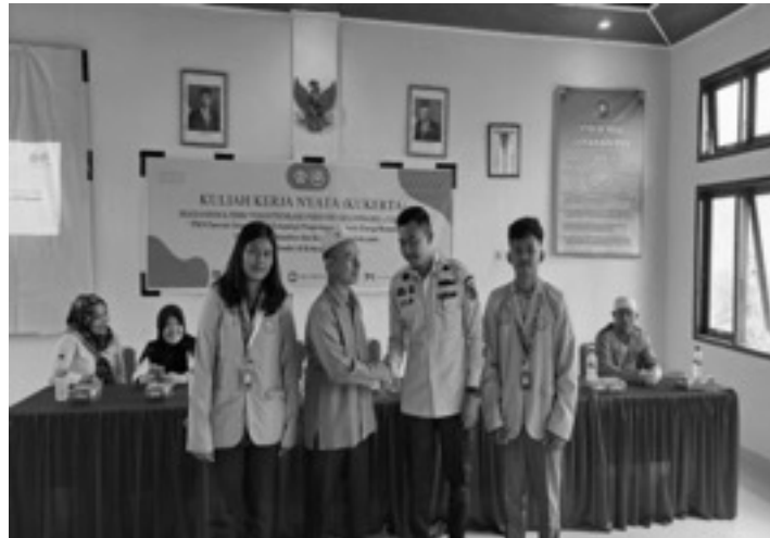
Gambar 6. Pernyataan terima kasih yang disampaikan Bapak Lurah

Gambar 5 menunjukkan sosialisasi kegiatan pengabdian yang dilakukan, dimana pihak kelurahan yang juga dihadiri tokoh masyarakat turut bertanya tentang maksud kegiatan ini, karena tidak semua warga yang diundang dalam kegiatan ini, yang di undang hanyalah UKM yang bergerak dalam bidang pembuatan ikan asin yaitu dari UKM. Tingkat kepuasan warga juga ditandai dengan ucapan terima kasih yang disampaikan bapak lurah saat sosialisasi kegiatan teknologi pengering ikan asin berbasis biomassa, seperti ditunjukkan dalam Gambar 6.