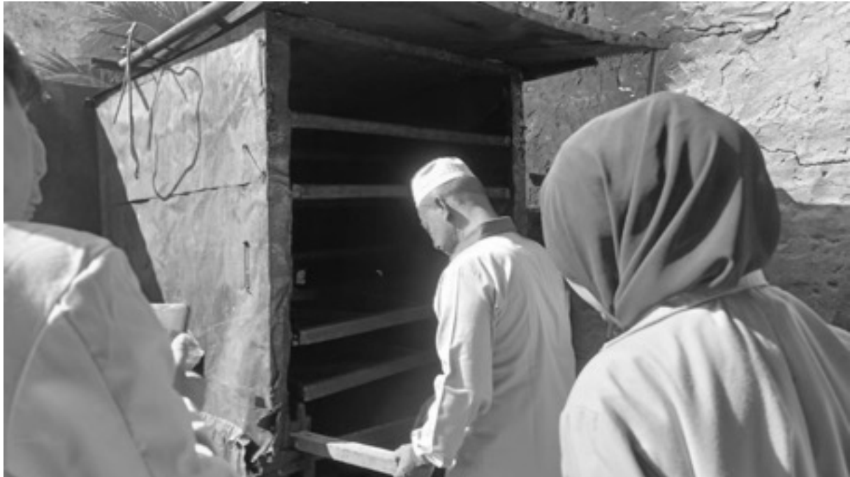
Gambar 1. Teknologi pengering sumber biomassa

Limbah tempurung kelapa sebagai sumber dapat digunakan untuk sumber energi (Muhammad, 2021). Teknologi ini akan memanfaatkan energy yang dihasilkan agar dapat digunakan untuk keperluan pengeringan produk pertanian (Juandi, & Haekal, 2016). Output dari kegiatan pengabdian yang akan dihasilkan ini adalah dalam bentuk teknologi pengeringan untuk pembuatan ikan asin, seperti ditunjukkan pada Gambar 1.