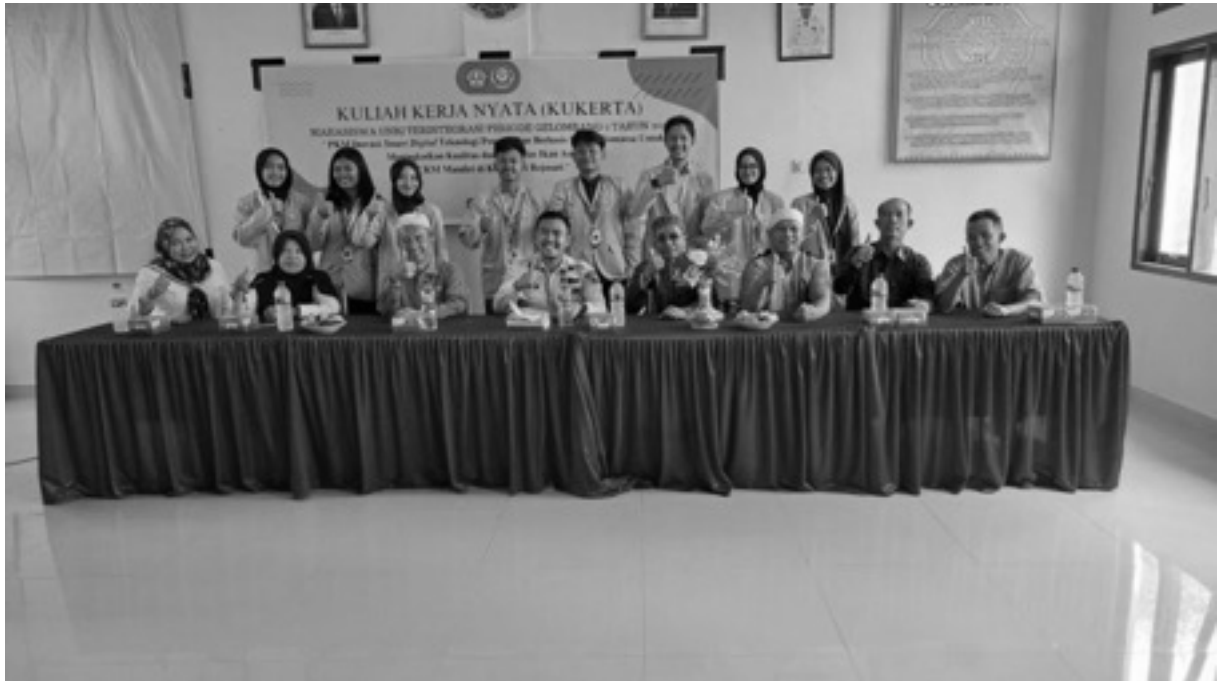
Gambar 5. Sosialisasi kegiatan di tingkat kelurahan

Selain itu juga, masyarakat juga kooperatif saat penyuluhan. Tidak hanya masyarakat yang berprofesi sebagai UKM Ikan asin saja yang antusias, tetapi juga masyarakat Kelurahan Rejosari juga tertarik dari penyuluhan ini, gambar 5 menunjukkan sosialisasi kegiatan di tingkat Kelurahan