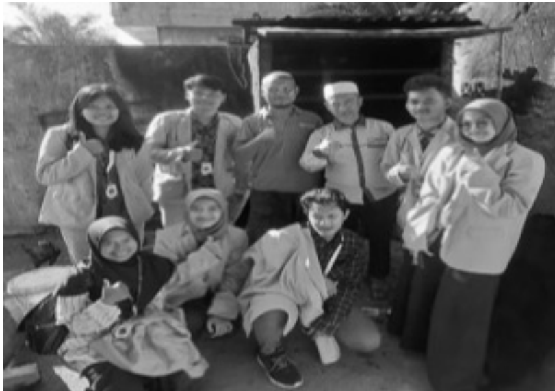
Gambar 2. UKM antusias dengan teknologi pengeringan pembuatan ikan asin

Gambar 2 menunjukkan antusias UKM dengan penggunaan alat teknologi pengering pembuatan ikan asin berbasis biomassa, dimana Ikan yang akan dikeringkan di letakkan dalam rak-rak pengering sebagaimana terlihat dalam gambar 3.