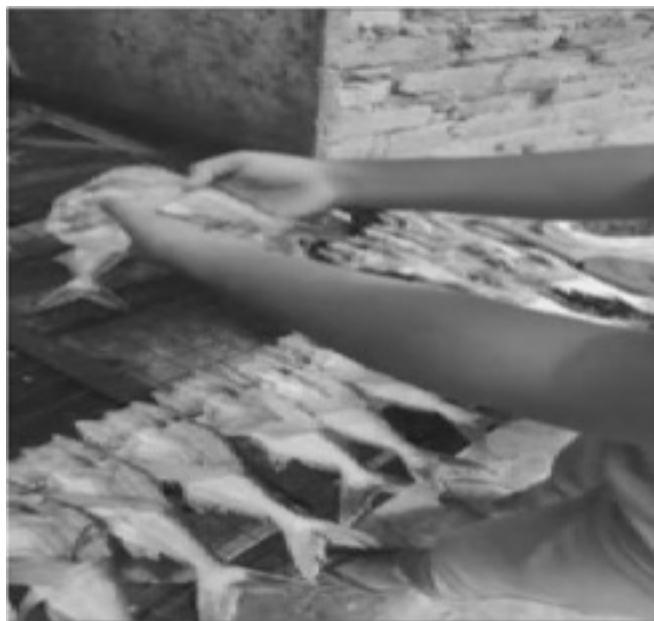
Gambar 3. Ikan diletakkan di atas rak-rak pengering

Gambar 2 menunjukkan antusias UKM dengan penggunaan alat teknologi pengering pembuatan ikan asin berbasis biomassa, dimana Ikan yang akan dikeringkan di letakkan dalam rak-rak pengering sebagaimana terlihat dalam gambar 3.