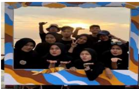
Gambar 2. Polarid

Pantai Wisata Raja Kecil memiliki taman cik mas yang juga digunakan sebagai kantin atau tempat menjual makanan dan minuman. Namun, taman tersebut kurang berwarna atau kurang hidup dikarenakan tidak banyaknya bunga-bunga yang tumbuh di area tersebut. Selain itu, kurang indahnya taman tersebut juga karena tidak ada hiasan atau pagar yang menonjolkan taman tersebut. Oleh karena itu, Mahasiswa Kukerta Integrasi UNRI mempersiapkan ide untuk membuat taman bunga cik mas. Taman bunga tersebut nantinya akan dibuat di 2 titik lokasi. Lokasi tersebut diantaranya ada di tengah-tengah taman, lalu lokasi selanjutnya ada di gerbang pintu masuk taman cik mas. Bahan dan alat yang dibutuhkan yaitu, bambu, kayu sengon, batu bata, gergaji, parang, cangkul, spidol. Untuk persiapan bahan utama yaitu bambu dan kayu dicari terlebih dahulu bersama pengurus Pantai.