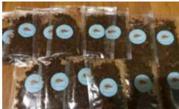
Gambar 10. Kemasan Abon