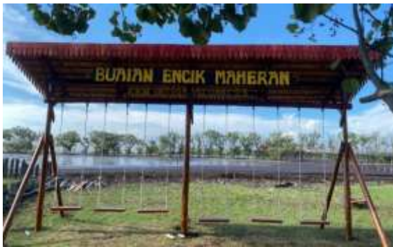
Gambar 4. Ayunan