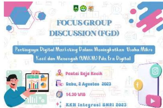
Gambar 9. Digital Marketing