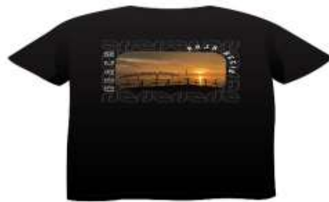
Gambar 11. Desain Baju