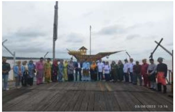
Gambar 13. Kegiatan FGD