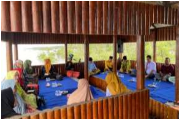
Gambar 12. Kegiatan FGD