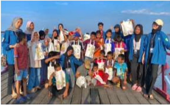
Gambar 8. Eco Printing