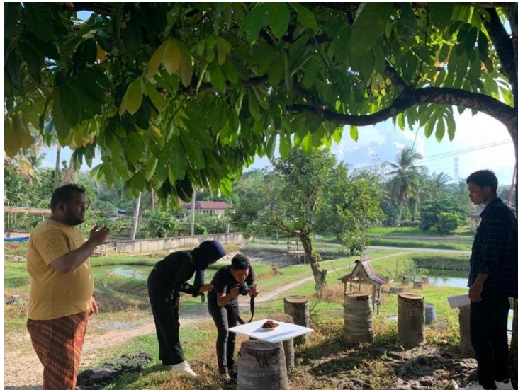
Gambar 2. Praktik foto produk kepada pemuda Desa

Tim membimbing pemuda Desa Koto Mesjid yang sudah dipilih sebelumnya untuk melakukan praktik langsung pengambilan foto produk dengan baik dan benar menggunakan kamera DSLR dan juga Handphone. Tim juga mengajarkan perihal aspek apa saja yang perlu diperhatikan dalam pengambilan foto produk mulai dari pencahayaan, sudut kamera, atribut yang sesuai, penataan tampilan produk serta pemilihan latar belakang. Pada praktik ini tim dan pemuda desa mengambil foto produk olahan milik Graha Perdana Sentosa berupa Rendang Salai dan Kerupuk Kulit. Kegiatan ini dilaksanakan pada tanggal 9 Agustus 2023 yang berlokasi di Sekretariat pembibitan Benih Ikan Karya Muda Fish.