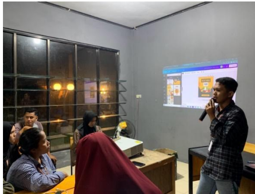
Gambar 5. Pelatihan design label produk dengan aplikasi Canva

produk UMKM Graha Perdana Sentosa sebagai contoh mengenai cara mendesign label produk yang baik dan benar. Kegiatan pelatihan ini dilaksanakan pada tanggal 11 Agustus 2023 di Aula Bumdes Desa Koto Mesjid.