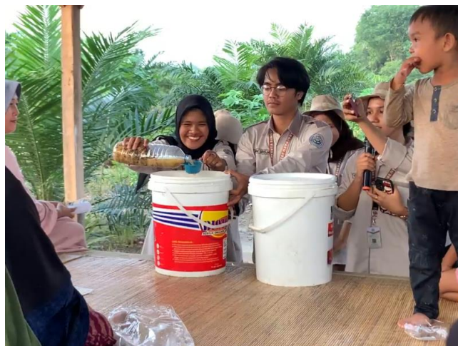
Gambar 5. Sosialisasi Dosis dan Cara Pengaplikasian POC.