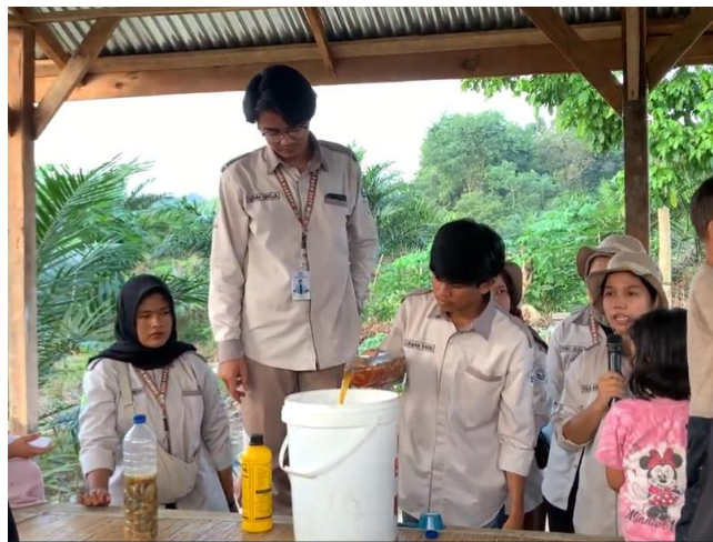
Gambar 4. Sosialisasi Bahan-Bahan Serta Cara Pembuatan POC.