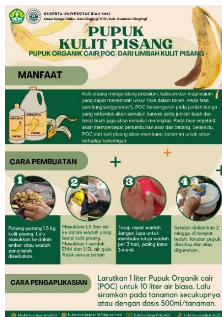
Gambar 1. Poster POC Dari Kulit Pisang

Sosialisasi POC ini merupakan bagian dari program kerja KUKERTA Bangun Kampung Gelombang II Mahasiswa Universitas Riau Tahun 2023 yang dilaksanakan pada Sabtu, 29 Juli 2023 di Desa Sungai Paku, Kecamatan Singingi Hilir, Kabupaten Kuantan Singingi. Sosialisasi pembuatan Pupuk Organik Cair (POC) dari limbah kulit pisang ini dilaksanakan bersama kepala desa, ibu-ibu PKK, petani cabai, dan warga Desa Sungai Paku di kebun cabai Desa Sungai Paku. Sasaran utama dari program ini yaitu ibu-ibu PKK, khususnya para petani kebun cabai desa. Sebelumnya, tim KUKERTA telah membuat sampel contoh hasil POC dari kulit pisang pada tanggal 18 Juli 2023 untuk dijadikan sebagai bahan praktek pengaplikasiannya. Kegiatan dilaksanakan dengan cara membagikan poster terlebih dahulu lalu dilanjutkan dengan demonstrasi langsung cara pembuatan menggunakan alat dan bahan dilanjutkan dengan sesi tanya jawab dan diakhiri dengan sesi demonstrasi dosis dan cara pengaplikasiannya.