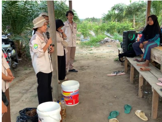
Gambar 3. Sosialisasi Definisi POC dan Manfaat Kulit Pisang Sebagai POC.