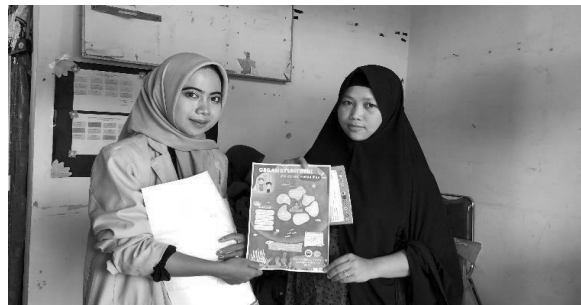
Gambar 3. Penyebaran Media Cetak

Kegiatan Terakhir dalam Program ini adalah pembuatan media informasi kesehatan yang berisi tentang pencegahan stunting dan demonstrasi gemar makan ikan dalam bentuk poster. Hal ini bertujuan untuk memberikan sebuah informasi kepada semua masyarakat agar dapat mewaspadai terjadinya stunting dengan memberikan manfaat ikan untuk tumbuh kembang anak.