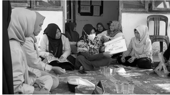
Gambar 1. Edukasi Stunting Bidan Desa Muara Kelantan