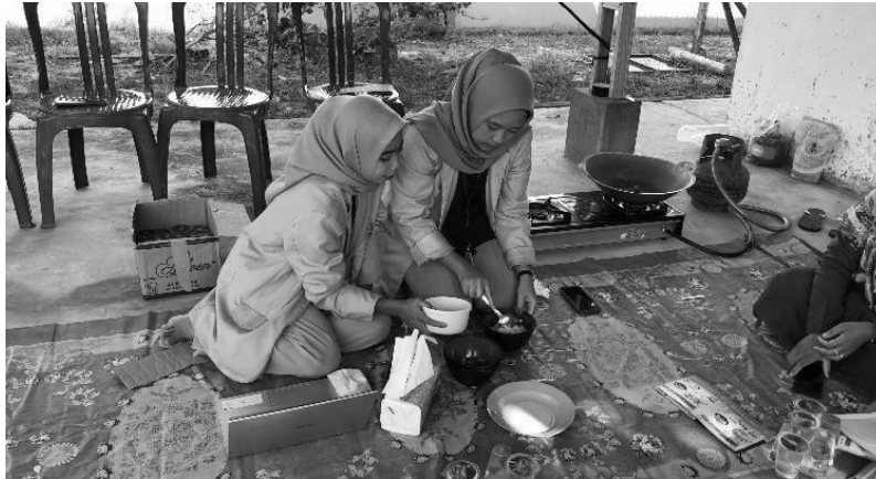
Gambar 2. Demonstrasi Olahan Ikan