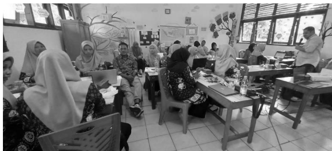
Gambar 2. Peserta saat bekerja dalam kelompok membuat buku berbasis kearifan lokal Indragiri Hulu

Kegiatan pelatihan ini bertujuan untuk menerapkan teknik penyusunan buku yang telah dipelajari dalam praktek nyata dan untuk memastikan bahwa peserta dapat menghasilkan buku yang berkualitas tinggi dan bermanfaat untuk pendidikan. Dokumentasi saat kegiatan peserta saat bekerja dalam kelompok, diskusi, dan sesi bimbingan yang diberikan oleh tim pengabdian dapat dilihat pada Gambar 2: