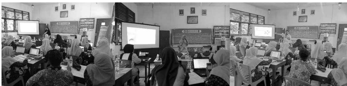
Gambar 1. Presentasi materi oleh tim pengabdian

Pada tahap ini, kegiatan dimulai dengan pemberian materi oleh tim pengabdian, yang meliputi teknik penyusunan buku berbasis kearifan lokal, pengenalan budaya Indragiri Hulu, serta cara menulis buku dengan efektif. Materi ini mencakup cara mengintegrasikan kearifan lokal dalam buku ajar dan pentingnya menyusun buku yang relevan dan autentik. Materi disampaikan melalui ceramah yang dilengkapi dengan alat bantu visual untuk memudahkan pemahaman peserta. Tim pengabdian menyampaikan materi dengan memanfaatkan slide PowerPoint, menjelaskan setiap bagian materi secara terstruktur. Penjelasan mencakup bagaimana menyusun buku yang berbasis kearifan lokal, cara mengintegrasikan elemen budaya lokal dalam buku, serta teknik penulisan yang baik. Dokumentasi saat pemberian materi diperlihatkan pada Gambar 1