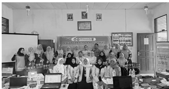
Gambar 4. Foto bersama dengan mitra

Buku yang dihasilkan selama pelatihan menunjukkan integrasi kearifan lokal dengan sangat baik, mencerminkan budaya dan tradisi Indragiri Hulu. Peserta berhasil menerapkan materi yang diajarkan mengenai pengenalan budaya dan teknik penulisan dalam karya mereka, menandakan bahwa tujuan utama untuk memperkenalkan kearifan lokal dalam pendidikan telah tercapai. Dokumentasi dari kegiatan ini dapat dilihat pada gambar 4: