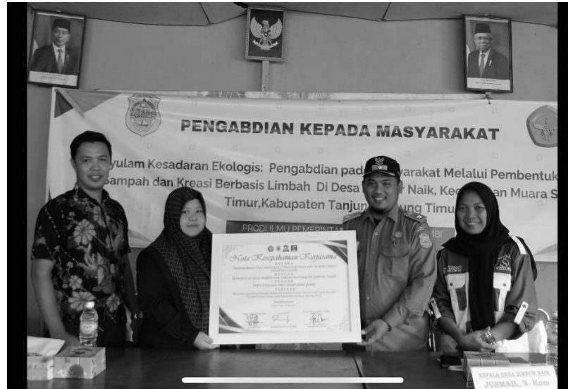
Gambar 4. Penandatanganan Nota Kesepahaman

Dalam gambar 3 dapat dijelaskan peserta kegiatan dan pihak-pihak yang dilibatkan, peserta kegiatan dihadiri 30 orang peserta yang terdiri dari perwakilan tokoh masyarakat, agama, pemuda, aparat desa, ibu PKK, BPD, para ketua RT, tenaga kesehatan. Melibatkan seluruh unsur masyarakat desa merupakan salah satu upaya dalam memberikan pengetahuan dan pemahaman akan persoalan lingkungan, sampah dan pengelolaannya serta bagaimana respon masyarakat dalam pelibatangannya kegiatan pengabdian.