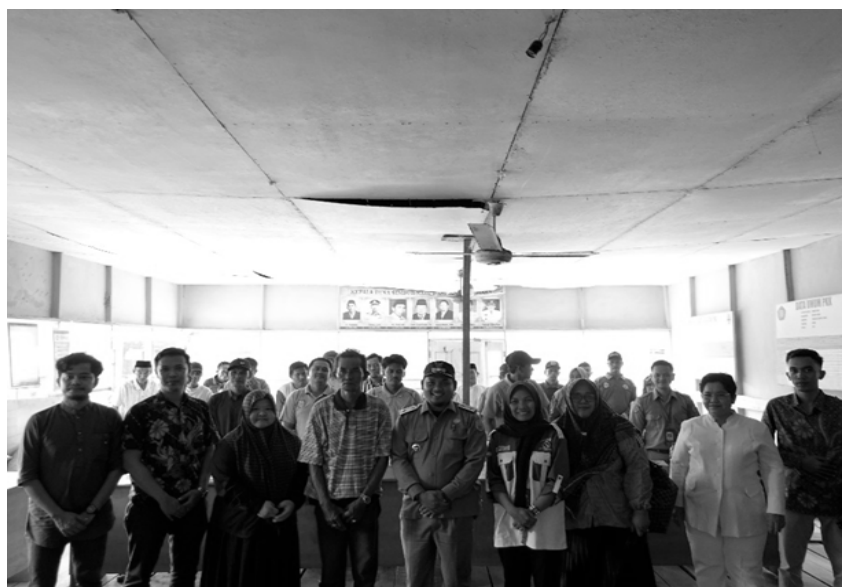
Gambar 3. Foto Bersama Peserta Kegiatan Pengabdian

Berikut beberapa dokumentasi kegiatan pengabdian pada masyarakat di Desa Simbur Naik Kabupaten Tanjung Jabung Timur Provinsi Jambi: