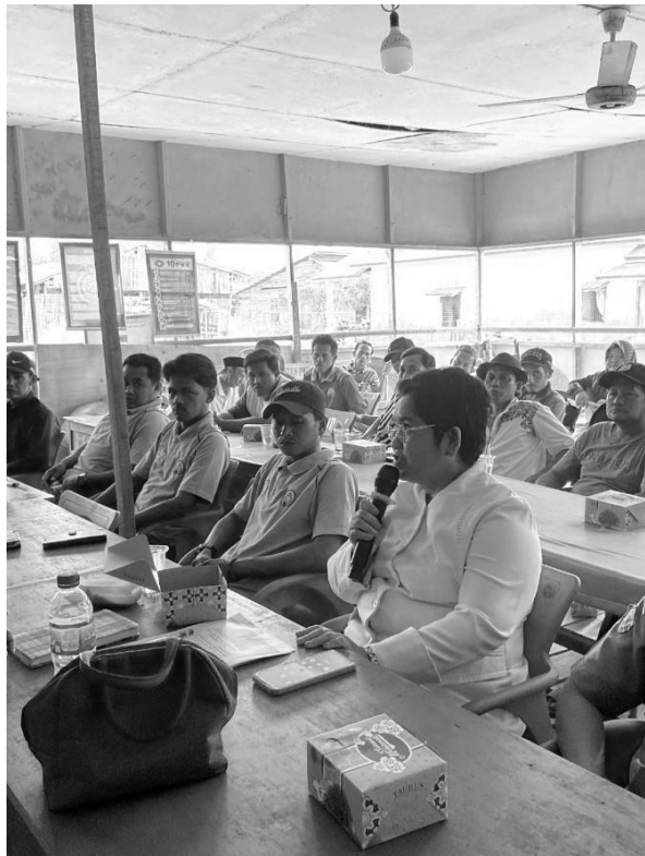
Gambar 2. Sesi Diskusi (Tanya Jawab)

Pada tahapan ini dilakukan dengan metode ceramah yang disampaikan dua pemateri yaitu dari TPBIS Omah Sinau dan perwakilan salah satu tim pengabdian secara bergantian. Materi dipresentasikan melalui Power Point, menyajikan video yang relevan mengenai lingkungan dan pelestariannya. Materi presentasi dijelaskan dari aturan wajib pemerintah tentang lingkungan, urgensi dalam menjaga dan melestarikan lingkungan, tujuan pembentukan bank sampah sampai dengan dampak dari pendirian bank sampah.