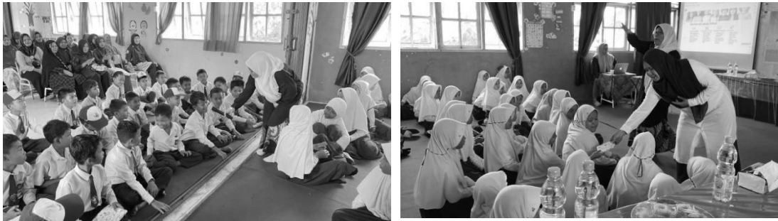
Gambar 4. Sesi tanya jawab dan pemberian hadiah

Pengabdian masyarakat dengan melaksanakan kegiatan sosialisasi dan edukasi terkait pencegahan bullying adalah salah satu program utama dari tim KUKERTA MBKM 10 SKS FISIP UNRI dalam mencapai poin 4 SDGs atau tujuan pembangunan yang berkelanjutan 2030, yaitu pendidikan yang berkualitas. Kegiatan sosialisasi edukasi yang melibatkan siswa, orang tua, dan pihak sekolah memiliki tujuan untuk meningkatkan kesadaran akan pentingnya mencegah dan menghentikan tindakan bullying. Dengan memberikan pemahaman yang lebih baik tentang apa itu bullying dan dampak negatifnya, sosialisasi ini bertujuan untuk menciptakan lingkungan sekolah yang aman dan kondusif untuk seluruh siswa di SD Negeri 12 Siak Kecil.