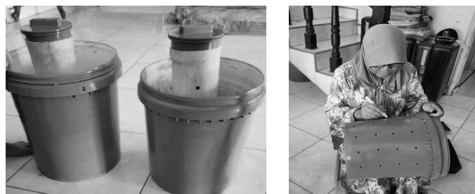
Gambar 3. Persiapan alat peraga mini biopori

Selanjutnya, tim pengabdian mempersiapkan peralatan yang diperlukan untuk pembuatan teknik mini biopori yaitu dengan memotong pipa paralon ukuran 4 inchi sepanjang 45 cm dan mempersiapkan wadah bekas kaleng cat sebagai tempat instalasi mini biopori. Hasil dari tahapan ini adalah berjalan dengan baik dan tersedianya peralatan yang mendukung kegiatan pelatihan pengabdian masyarakat di Kantor Desa Sungai Berbari Kecamatan Pusako Kabupaten Siak. Sebanyak 30 set alat perlengkapan mini biopori disertai dengan satu set berbagai bibit tanaman hortikultura telah diserahkan kepada warga masyarakat untuk selanjutnya dipraktekkan secara mandiri oleh masyarakat dan didampingi oleh mahasiswa tim kukerta MBKM Universitas Riau Tahun 2024.