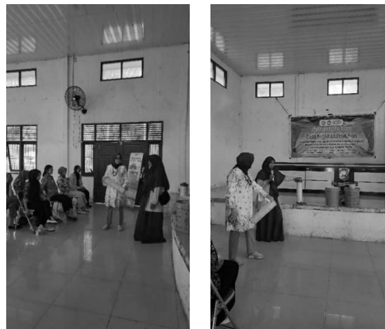
Gambar 4. Situasi kegiatan pelatihan

Kegiatan pelatihan ini dilakukan dengan penyampaian materi dengan ceramah dan diskusi melalui presentasi dan demonstrasi cara pembuatan teknik mini biopori. Pemateri juga menyampaikan cara pembuatan teknik minibiopori yang berlangsung komunikasi dua arah dimana terjadinya diskusi antara pemateri dengan peserta pelatihan. Terdapat 30 orang peserta yang mengikuti kegiatan pelatihan ini dan dengan antusias. Selain itu, peserta juga menunjukkan pemahaman yang baik tentang teknik mini biopori dan penerapannya.