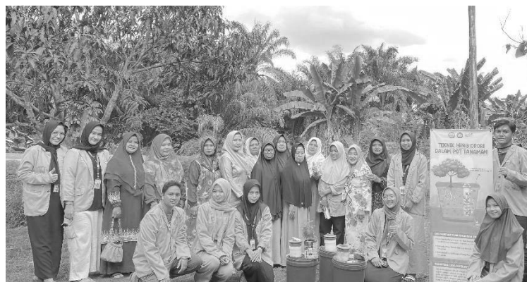
Gambar 5. Praktek Pembuatan Teknik Mini Biopori yang didampingi oleh mahasiswa kukerta

Kegiatan ini dilakukan pada hari Jum'at, 02 Agustus 2024 yang dilaksanakan dan dibimbing oleh mahasiswa kukerta MBKM Universitas Riau tahun 2024 dan diikuti oleh 30 orang peserta ibu – ibu PKK. Ibu – ibu PKK secara mandiri membuat mini biopori dalam wadah bekas yang sebelumnya sudah diserahkan oleh tim pengabdian pada saat dilakukan pelatihan. Peserta dibagikan kedalam beberapa kelompok untuk membuat teknik minibiopori di dalam pot tanaman yang menggunakan wadah bekas. Pada tahapan ini, peserta memiliki keterampilan praktis yang baik untuk pembuatan teknik mini biopori di dalam wadah bekas ramah lingkungan. Kegiatan ini juga berkontribusi pada pengelolaan sampah organik rumah tangga yang efektif dan ramah lingkungan.