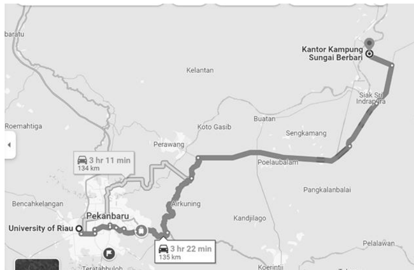
Gambar 1. Lokasi kegiatan pengabdian yaitu di Desa Sungai Berbari dengan jarak dari Universitas Riau adalah sekitar 135 Km

Desa Sungai Berbari terletak di Kecamatan Pusako, Kabupaten Siak, merupakan daerah agraris dengan mayoritas penduduk bekerja di sektor pertanian. Berdasarkan data BPS Kabupaten Siak Tahun 2022, jumlah penduduk desa ini sekitar 1.200 jiwa, dengan 65% bekerja di sektor pertanian (Badan Pusat Statistik, 2022). Mayoritas penduduk bertani padi dan karet sebagai komoditas utama. Mayoritas petani di Desa Sungai Berbari memiliki lahan dengan ukuran yang bervariasi. Sebanyak 47,27% petani memiliki lahan seluas 1-2 hektar, sedangkan 25,45% memiliki lahan di bawah 1 hektar. Petani pemilik lahan berjumlah 65,5%, sementara 34,5% adalah petani penggarap yang mengelola lahan milik pihak lain. Namun, tantangan yang dihadapi meliputi kesuburan tanah yang menurun, penggunaan pupuk kimia yang intensif, dan pengelolaan limbah organik yang kurang efisien. Penurunan kualitas tanah dan ketergantungan pada pupuk kimia berkontribusi terhadap biaya produksi yang tinggi dan menurunnya keberlanjutan pertanian (Mardiana, Iyan dan Zamaya, 2019).