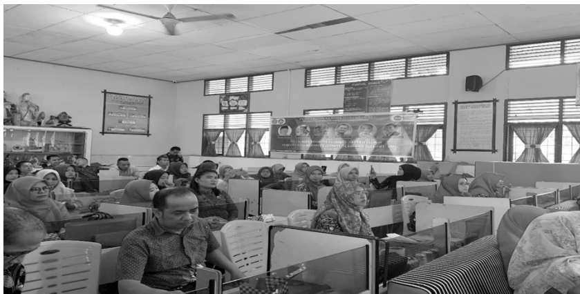
Gambar 2: Peserta pelatihan pembuatan modul sejarah lokal terintegrasi pelajaran sejarah di SMA yang diikuti oleh 39 orang

Setelah diberikan pemahaman pentingnya sejarah lokal terintegrasi pada materi sejarah SMA, pelatihan dilanjutkan dengan materi rancangan pembuatan modul tersebut. Adapun materi pada rancangan itu meliputi pertama analisis kondisi dan kebutuhan guru, siswa dan sekolah. Kedua, identifikasi dan tentukan dimensi profil pelajar pancasila. Ketiga, tentukan alur tujuan pembelajaran yang akan dikembangkan menjadi modul ajar. Keempat, susun modul ajar sesuai dengan komponen yang tersedia. Kelima, pelaksanaan pembelajaran. Keenam evaluasi dan tindak lanjut.