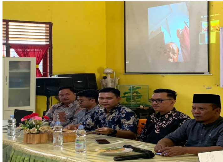
Gambar 1: Pemberian materi mengenai pentingnya sejarah lokal dalam pembentukan karakter bangsa oleh pemateri