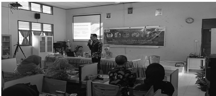
Gambar 3. Pemateri menyampaikan rancangan pembuatan modul sejarah lokal terintegrasi materi sejarah SMA

Setelah diberikan pemahaman pentingnya sejarah lokal terintegrasi pada materi sejarah SMA, pelatihan dilanjutkan dengan materi rancangan pembuatan modul tersebut. Adapun materi pada rancangan itu meliputi pertama analisis kondisi dan kebutuhan guru, siswa dan sekolah. Kedua, identifikasi dan tentukan dimensi profil pelajar pancasila. Ketiga, tentukan alur tujuan pembelajaran yang akan dikembangkan menjadi modul ajar. Keempat, susun modul ajar sesuai dengan komponen yang tersedia. Kelima, pelaksanaan pembelajaran. Keenam evaluasi dan tindak lanjut.