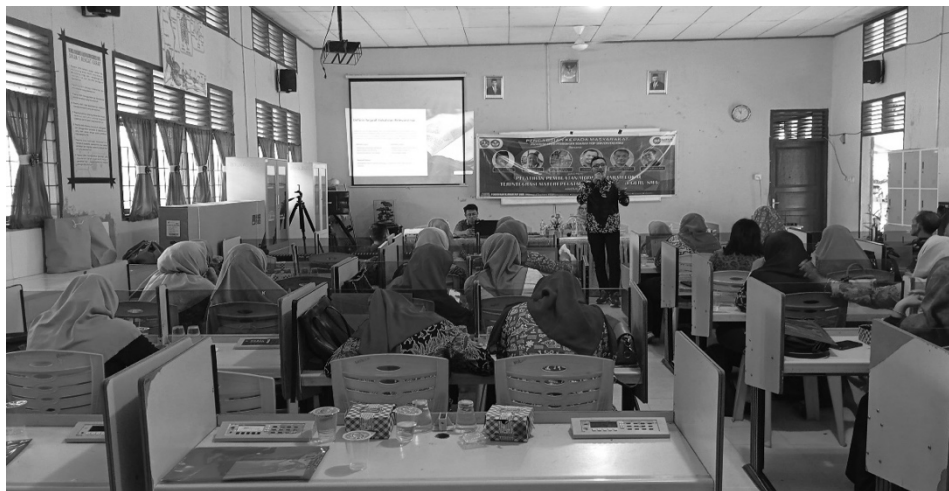
Gambar 4 Pemateri memberikan arahan dalam pembuatan rancangan modul sejarah lokal terintegrasi pelajaran sejarah di SMA

Kelima, beberapa guru melakukan praktik pelaksanaan pembelajaran yang sesuai dengan modul yang disusun. Tahap ini untuk melihat bagaimana kemampuan guru dalam pembelajaran sejarah. Sehingga kedepannya dapat mengidentifikasi kelebihan dan kelemahan modul yang disusun. Keenam, guru melakukan evaluasi dan tindak lanjut terkait modul yang disusun. Tahap akhir ini bertujuan untuk menilai keseluruhan proses yang telah dilakukan. Guru dapat mengukur dan menilai efektivitas sebuah modul