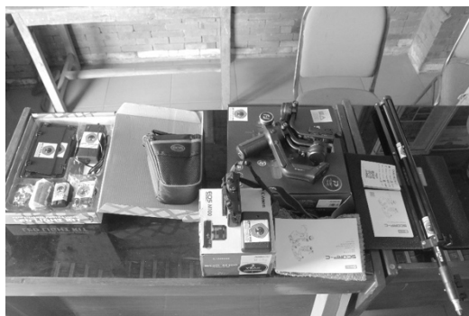
Gambar 3 Pelabelan Aset Bumdes untuk Wisata Mbencirang

Pada hari keempat, dilaksanakan praktik editing terhadap hasil pengambilan gambar yang telah dilakukan pada hari sebelumnya. Proses editing dilakukan agar hasil konten memiliki kesinambungan dan sesuai dengan konsep yang telah dituliskan pada naskah. Peserta dilatih untuk dapat menerapkan kesinambungan gambar yang tepat, penerapan pewarnaan yang baik, dan voice-over.