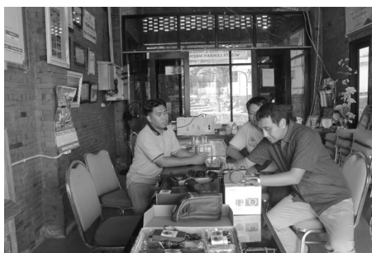
Gambar 2 Pembukaan PKM di Desa Kebontunggul

Pada hari kedua dan ketiga, setiap kelompok diberikan tugas untuk membuat konten audiovisual sesuai dengan kreativitas para peserta, mulai dari tahapan pra-produksi, produksi, hingga pasca-produksi. Pertama-tama, para peserta diberikan waktu untuk menyusun naskah konten audiovisual yang didampingi oleh para dosen dan mahasiswa. Setelah itu, para peserta melaksanakan produksi audiovisual berdasarkan kelompoknya masing-masing dengan membawa ide konten yang berbeda. Semua proses produksi dilakukan dalam pendampingan dan pengawasan dosen dan mahasiswa Ilmu Komunikasi Universitas 17 Agustus 1945 Surabaya.