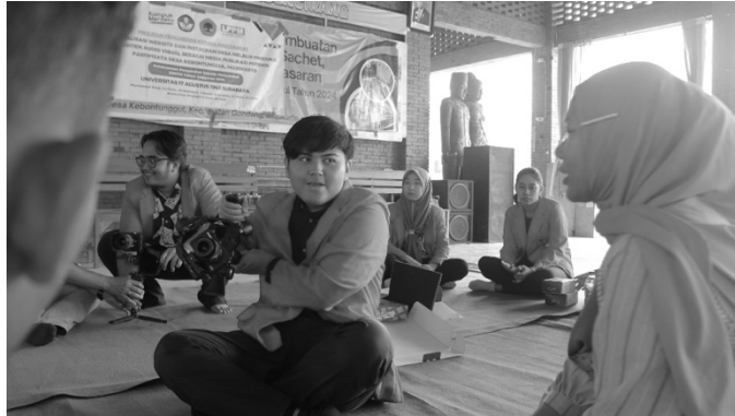
Gambar 4 Proses Pelatihan Audio Visual

menyebarkan lembar evaluasi yang dibagikan kepada peserta. Evaluasi tersebut bertujuan untuk memberikan penilaian seberapa jauh keberhasilan program pengabdian kepada masyarakat ini, dan saran-saran yang membangun dari peserta akan digunakan sebagai langkah perbaikan bagi penyelenggaraan program pengabdian kepada masyarakat program studi ilmu komunikasi dan bahasa inggris Universitas 17 Agustus 1945 Surabaya selanjutnya. Berikut ini adalah hasil evaluasi dari peserta terhadap pelaksanaan pengabdian kepada masyarakat program studi ilmu komunikasi dan bahasa inggris.