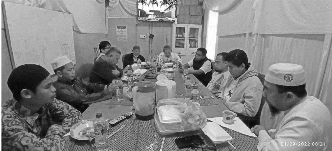
Gambar 4. Sosialisasi dan pembahasan tugas dan fungsi masing masing pihak yang terlibat dalam inisiasi Pembangunan LKP AGIBS Taruna.