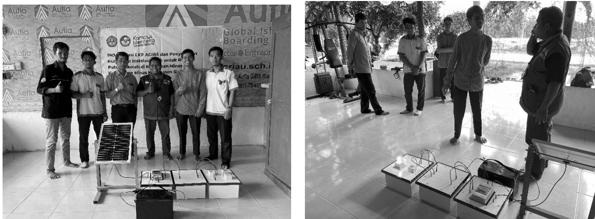
Gambar 7. Penyerahan dan pemanfaatan modul pelatihan instalasi PLTS