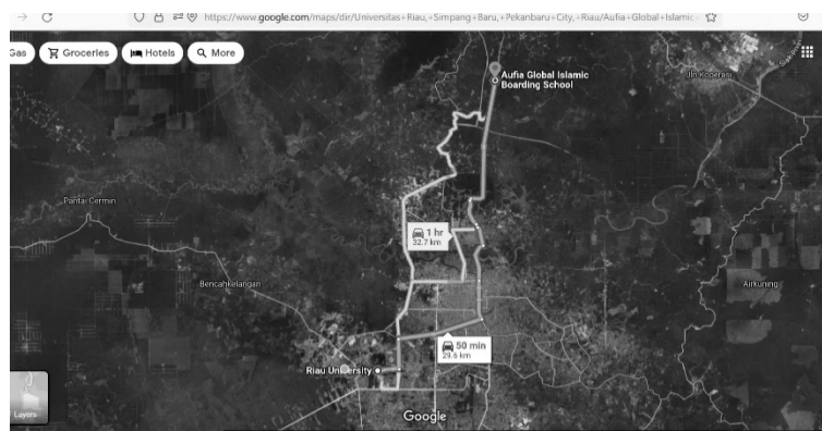
Gambar 1. Peta Lokasi Pondok Pesantren Aufia Global Islamic Boarding School (Google, 2024)

Pondok pesantren Aufia Global Islamic Boarding School (PP AGIBS) berada di kelurahan Minas Jaya, Kecamatan Minas, Kabupaten Siak, Provinsi Riau. PP AGIBS berjarak 37.2 km dari Universitas Riau dan dapat ditempuh dalam 1 jam dengan menggunakan kendaraan roda 4 maupun roda 2 seperti ditunjukkan pada gambar 1. Kurikulum PP AGIBS menitikberatkan pada pendidikan keislaman, sehingga sedikit yang berisi kompetensi sains dan teknologi, seperti Teknik Instalasi PLTS. Pada umumnya kelurahan Minas Jaya berada di area ex PT Chevron Pacific Indonesia, sebuah perusahaan tambang minyak terbesar di Provinsi Riau pada masa lalu. Penduduk Minas Jaya dahulunya kebanyakan berprofesi di Chevron sebagai tenaga kerja kasar, antara lain sebagai: tenaga kebersihan dan tenaga satuan pengamanan.