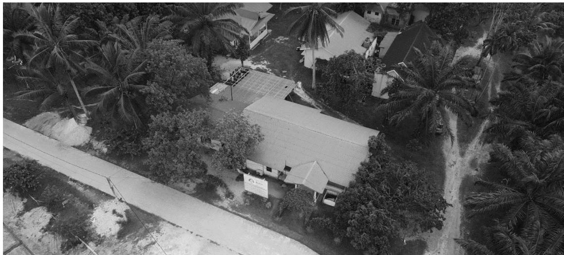
Gambar 5. Lokasi bangunan LKP AGIBS Taruna yang disetujui oleh pihak PP AGIBS

Lokasi LKP AGIBS Taruna yang telah disetujui oleh pihak PP AGIBS ditunjukkan seperti Gambar 5 berikut.