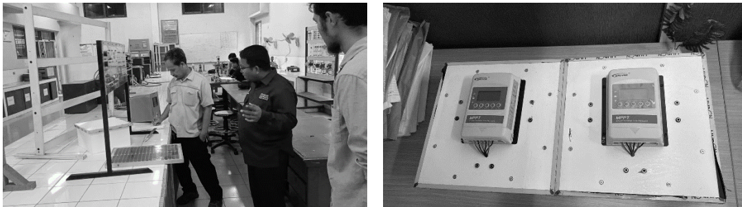
Gambar 6. Realisasi pembanguana modul pelatihan instalasi PLTS

Modul pelatihan telah dibangun oleh tim pengabdian Universitas Riau yang dapat digunakan oleh seluruh peserta yang berasal dari remaja putus sekolah sehingga dapat memahami prinsip dasar, keterampilan instalasi PLTS dan mekanisme perawatan PLTS dengan benar. Proses pembanguana modul pelatihan instalasi PLTS dilalui melalui tahapan diskusi, perencanaan, perakitan, pembangunan dan pengujian dengan demikian modul yang dibangun bekerja sesuai standard yang ada. Proses pembangunan ini ditunjukkan dalam rangkaian foto seperti ditunjukkan pada gambar 6. Sedangkan gambar 7 menunjukan proses penyerahan dan penggunaan modul pelatihan instalasi PLTS yang diadakan di PP AGIBS.