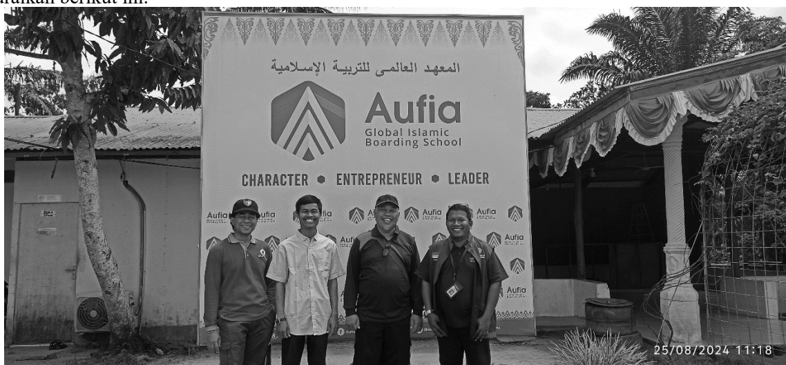
Gambar 3. Sosialisasi awal tim pengabdian Universitas Riau di PP AGIBS

Pelaksanaan sosialisasi ini melibatkan beberapa pihak, antara lain: tim pengabdian Universitas Riau, PP AGIBS dan pihak Kelurahan Minas Jaya. Adapun tujuan sosialisasi seperti yang ditunjukkan pada Gambar 3 dan Gambar 4 adalah untuk merumuskan pembagian tugas dan fungsi masing masing pihak sehingga inisiasi LKP ini dapat terwujud dengan berdirinya LKP AGIBS. Dalam kegiatan sosialisasi ini sudah dilakukan beberapa kesepakatan seperti diuraikan berikut ini.