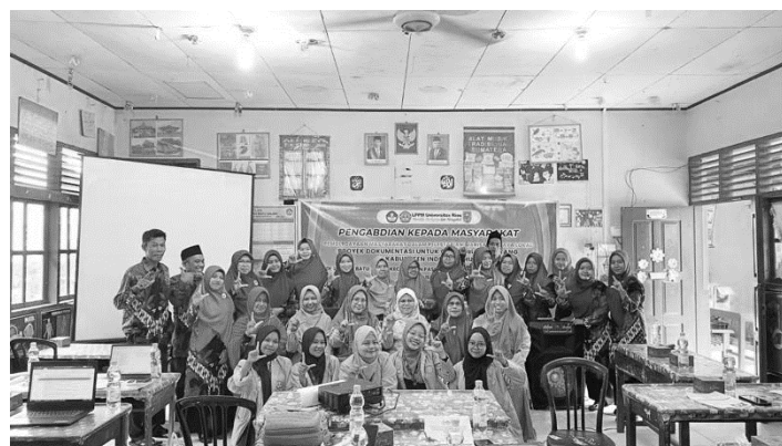
Gambar 3. Pemateri dan Peserta PkM

Evaluasi keseluruhan terhadap kegiatan menunjukkan hasil yang sangat positif. Berdasarkan kuesioner yang dibagikan kepada peserta pelatihan, 94% dari mereka menyatakan bahwa program ini memberikan kontribusi signifikan terhadap pelestarian budaya lokal. Sebanyak 92% peserta merasa bahwa pelatihan ini membantu meningkatkan profesionalisme mereka sebagai pendidik, terutama dalam mengintegrasikan budaya lokal ke dalam proses pembelajaran. Selain itu, 90% peserta berencana untuk mengaplikasikan keterampilan ini dalam mengajar di sekolah masing-masing, menunjukkan adanya dampak berkelanjutan dari program ini.