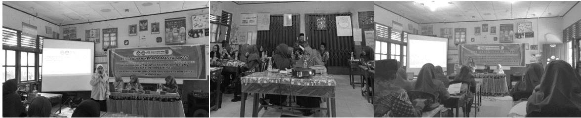
Gambar 1. Dokumentasi Pelatihan