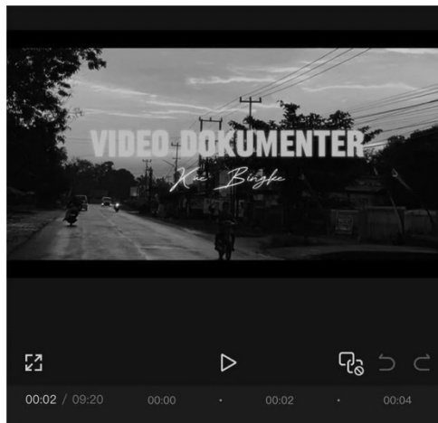
Gambar 2. Cover Video Dokumenter Kue Bingke

Evaluasi keseluruhan terhadap kegiatan menunjukkan hasil yang sangat positif. Berdasarkan kuesioner yang dibagikan kepada peserta pelatihan, 94% dari mereka menyatakan bahwa program ini memberikan kontribusi signifikan terhadap pelestarian budaya lokal. Sebanyak 92% peserta merasa bahwa pelatihan ini membantu meningkatkan profesionalisme mereka sebagai pendidik, terutama dalam mengintegrasikan budaya lokal ke dalam proses pembelajaran. Selain itu, 90% peserta berencana untuk mengaplikasikan keterampilan ini dalam mengajar di sekolah masing-masing, menunjukkan adanya dampak berkelanjutan dari program ini.