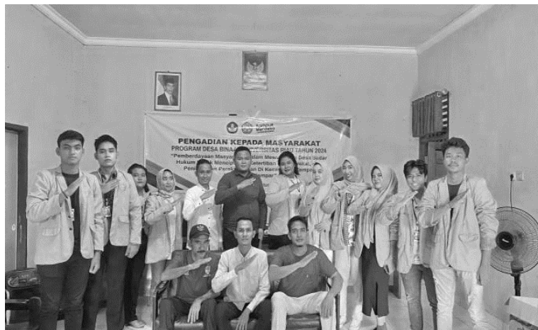
Gambar 1 Sosialisasi Hukum dan Ketertiban Masyarakat di Desa Batu Belah

Secara keseluruhan, program pemberdayaan masyarakat ini tidak hanya memberikan pengetahuan dan ilmu baru kepada masyarakat, tetapi juga mendorong mereka untuk berinovasi dan beradaptasi dengan perubahan globalisasi untuk desa sadar hukum. Dengan demikian, diharapkan masyarakat desa dapat menjadi masyarakat yang dikenal luas dengan masyarakat sadar hukum, serta meningkatkan perekonomian masyarakat yang dapat bersaing dengan masyarakat lain. Dengan demikian, kehidupan masyarakat desa menjadi lebih baik dari sebelumnya dan lebih sejahtera.