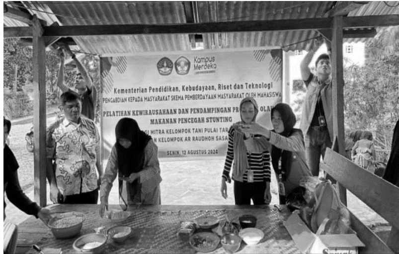
Gambar 5. Pelatihan Kewirausahaan di Desa Ranah Baru