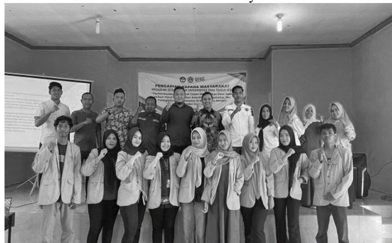
Gambar 2. Sosialisasi Hukum dan Ketertiban Masyarakat di Desa Naumbai