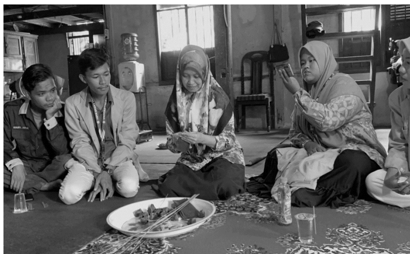
Gambar 4 . Pendampingan UMKM Palito Daun di Desa Naumbai