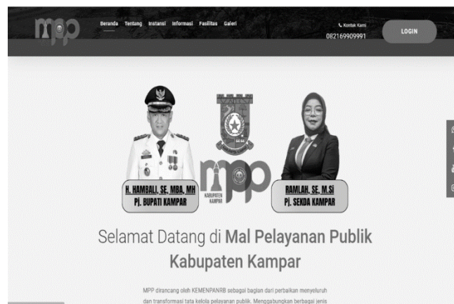
Gambar 5. Menu Isian Mal Pelayanan Publik Kabupaten Kampar

Pelaku usaha desa akan lebih percaya diri dalam mempromosikan dan memasarkan barang mereka di tingkat lokal, nasional, dan internasional dengan pemahaman hukum yang baik. Pusat informasi hukum dapat menawarkan nasihat tentang cara membuat kontrak bisnis, memahami pajak, dan menangani aspek legal dari pertumbuhan perusahaan. Selain itu, mengingat betapa pentingnya platform online untuk mendukung pemasaran produk desa saat ini, penting untuk meningkatkan pemahaman tentang hukum e-commerce dan pemasaran digital.