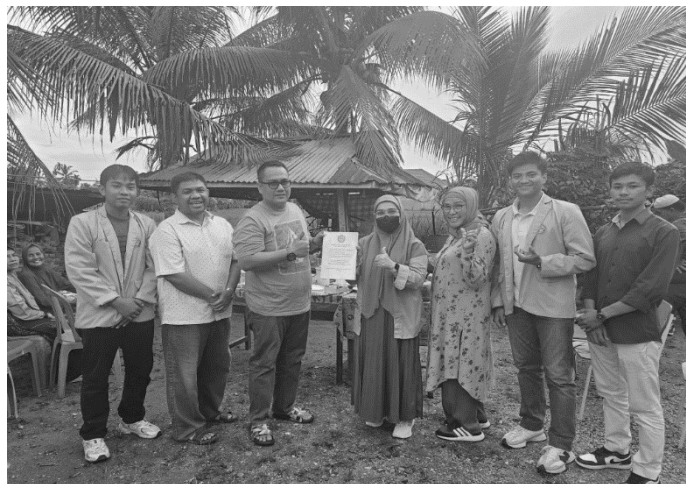
Gambar 3. Penyerahan Draf Perdes Kepada Kepala Desa Ranah Baru