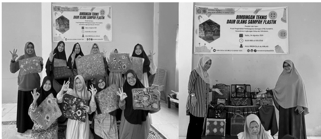
Gambar 7. Bahan baku dari sampah plastik kresek menjadi berbagai kerajinan tangan

Penilaian dan Evaluasi: Produk yang telah selesai dinilai dan dievaluasi oleh instruktur dan peserta lainnya. Hal ini bertujuan untuk memastikan bahwa produk yang dihasilkan memiliki kualitas yang baik dan layak untuk dijual.