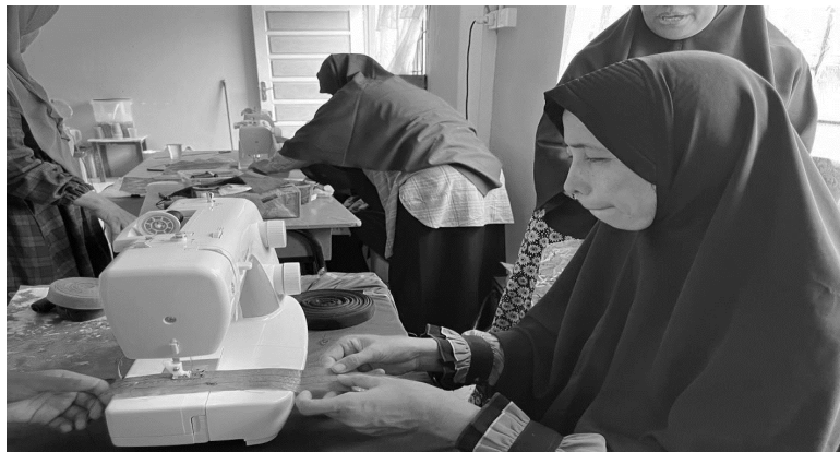
Gambar 6. Menjahit bahan baku dari limbah kresek yang telah diolah

Finishing: Setelah produk utama selesai dibuat, tahap finishing dilakukan untuk memberikan sentuhan akhir pada produk. Ini bisa berupa penambahan aksesoris, perapihan produk, atau pengecatan untuk meningkatkan estetika dan nilai jual produk.