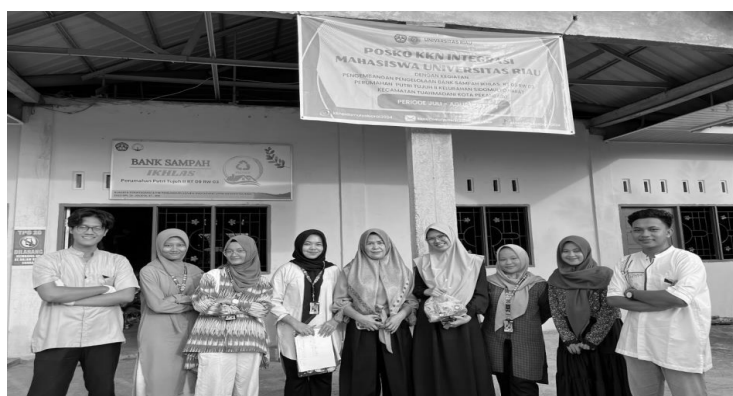
Gambar 1. Bank Sampah Ikhlas Perumahan Putri Tujuh II

Dengan adanya bank sampah ikhlas (Gambar 1), masyarakat di RT 09 RW 03 Perumahan Putri Tujuh II Kelurahan Sidomulyo Barat telah berhasil mengubah paradigma mereka tentang sampah menjadi sumber potensial yang dapat diolah dan dimanfaatkan kembali. Selain berdampak positif terhadap lingkungan, bank sampah juga memberikan manfaat ekonomi kepada masyarakat melalui penjualan sampah yang telah terkumpul.