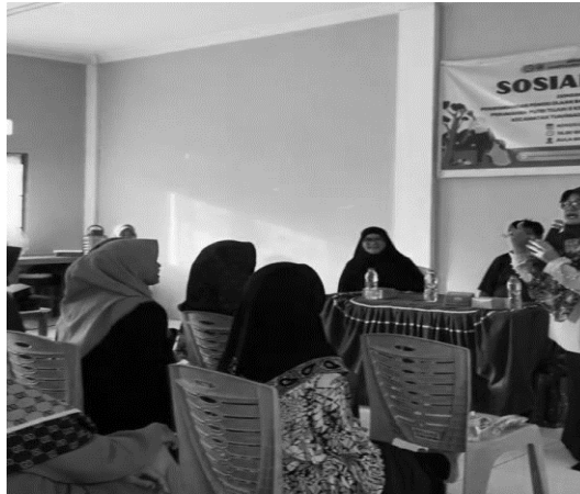
Gambar 2. Edukasi dan Sosialisasi Warga

Pemberian Insentif Awal: Untuk menarik minat warga, bisa juga diberikan insentif awal, seperti tas belanja ramah lingkungan, atau poin reward yang dapat ditukar dengan barang kebutuhan sehari-hari. Insentif ini berfungsi sebagai motivasi awal bagi warga yang mungkin masih ragu untuk ikut serta.