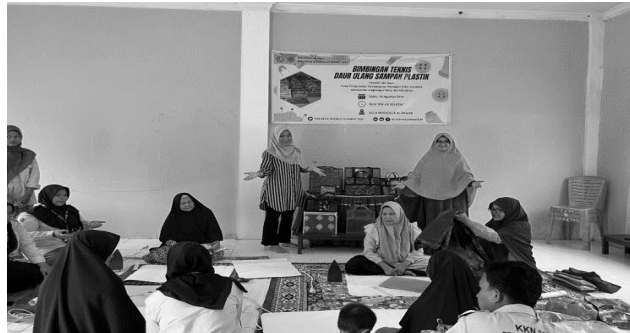
Gambar 4. Pelatihan Pembuatan kresek menjadi bahan baku Pengumpulan dan Pemilahan Limbah Plastik

Pelatihan ini berfokus pada mengajarkan warga bagaimana mengolah limbah plastik, khususnya kantong kresek dan plastik lainnya, menjadi bahan baku yang bisa digunakan kembali untuk membuat berbagai produk yang bermanfaat. Berikut adalah penjelasan mengenai kegiatan ini (Gambar 4):