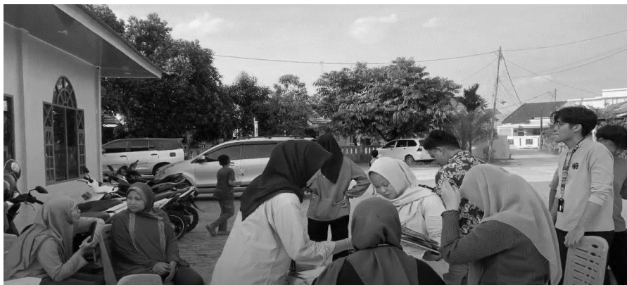
Gambar 3. Fasilitas Penjemputan Sampah

Salah satu faktor kunci dalam meningkatkan jumlah nasabah adalah perluasan jangkauan sosialisasi. Awalnya, sosialisasi hanya terfokus pada warga di lingkungan RT 09 RW 03. Namun, dengan memperluas kegiatan sosialisasi ke luar wilayah tersebut, minat masyarakat untuk bergabung dalam program bank sampah semakin meningkat. Hal ini menunjukkan bahwa sosialisasi yang intensif dan berkelanjutan sangat penting untuk membangun kesadaran masyarakat akan pentingnya pengelolaan sampah yang baik.