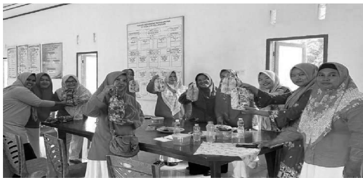
Gambar 1. Kegiatan Praktik Penggunaan Furoshiki

Di akhir kegiatan, tim PkM menyebar kuesioner untuk mengetahui persepsi ibu-ibu anggota PkM mengenai kegiatan pelatihan dan juga sebagai evaluasi kegiatan.