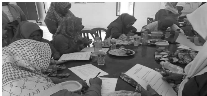
Gambar 2. Kegiatan Pengisian Kuesioner

Dalam pelaksanaan kegiatan mengenal budaya Jepang yaitu pelatihan penggunaan kain pembungkus furoshiki, terdapat 4 aspek yang diperoleh melalui kuesioner yang dibagikan kepada anggota PKK yaitu aspek praktik penggunaan furoshiki, penerimaan sebagai budaya baru, upaya dan sarana penyebaran furoshiki, dan ketertarikan terhadap furoshiki.