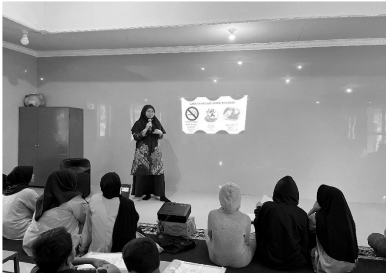
Gambar 2. Penyampaian materi tentang perkembangan aspek biologis dan psikoseksual remaja