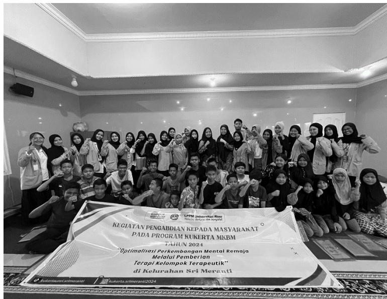
Gambar 5. Peserta dan Tim Pengabdian Masyarakat FKp Unri berfoto bersama