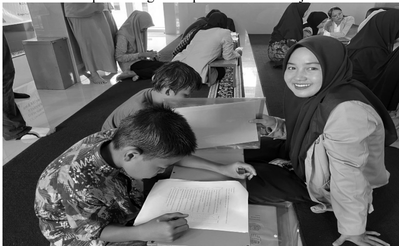
Gambar 3. Peserta mengisi pre test didampingi mahasiswa tim pengabdian