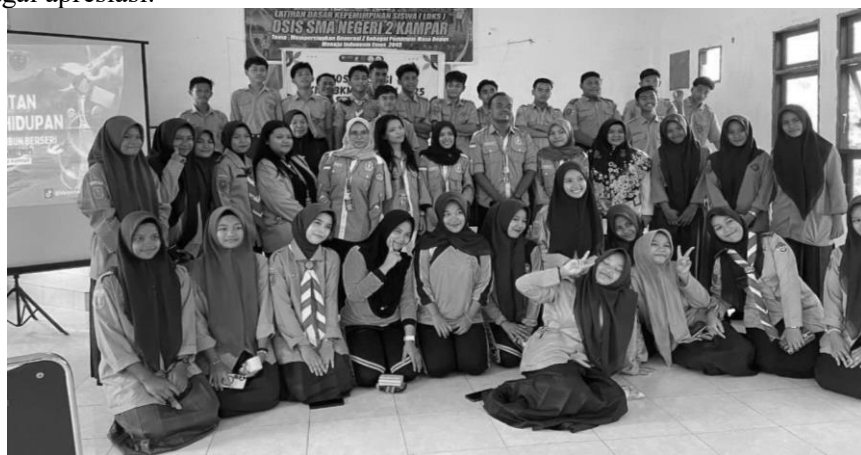
Gambar 8. Penutupan dan sesi foto

Sesi tanya jawab pada saat sosialisasi tentang pengelolaan sumber daya alam dan melestarikan hutan larangan adat berlangsung dengan interaktif dan penuh antusiasme. Para siswa terlihat aktif menjawab pertanyaan terkait materi. Pada saat sesi tanya jawab ini siswa tidak hanya mendapatkan pengetahuan juga menambahkan rasa percaya diri bagi siswa. Pada sesi terakhir sesi tanya jawab, mahasiswa KUKERTA MBKM FH UNRI memberikan hadiah sederhana kepada siswa yang bertanya dan menjawab pertanyaan tentang sosialisasi hukum sumber daya alam sebagai apresiasi.