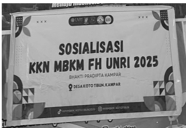
Gambar 2. Dokumentasi persiapan sosialisasi

Persiapan sosialisasi dilakukan dengan berbagai kegiatan, seperti mempersiapkan spanduk, membersihkan ruangan, dan mempersiapkan sound system supaya berjalan dengan tenang dan tidak gangguan teknis.