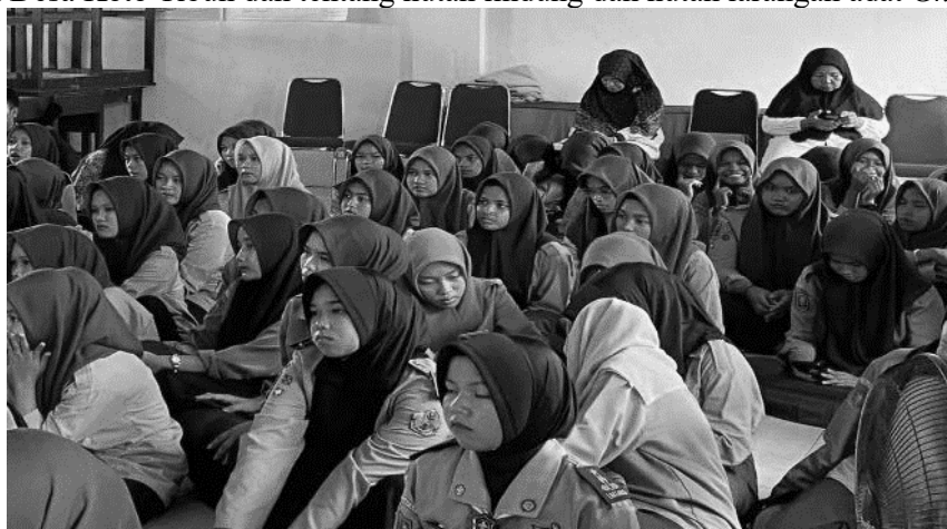
Gambar 6. Pengisian soal Pre-Test dan Post-Test

Penyampaian materi sosialisasi merupakan bagian inti dari kegiatan sosialisasi yang bertujuan untuk menyampaikan informasi, pengetahuan, atau panduan kepada peserta secara jelas, terstruktur, dan mudah dipahami. Bagian ini biasanya dilakukan oleh narasumber atau pihak yang berkompeten dalam topik yang dibahas, dengan tujuan memastikan peserta memahami substansi kegiatan dan dapat mengaplikasikan informasi yang diterima. Penyampaian materi disampaikan oleh dua orang pemateri. Pada pemateri pertama menjelaskan tentang apa yang dimaksud dengan hukum sumber daya alam. Tujuan dan peran pengelolaan sumber daya alam, dan pengaturan tentang hukum sumber daya alam. Sedangkan, pemateri kedua menjelaskan tentang pengelolaan sumber daya alam yang ada di Desa Koto Tibun dan tentang hutan lindung dan hutan larangan adat Ghimbo Potai .