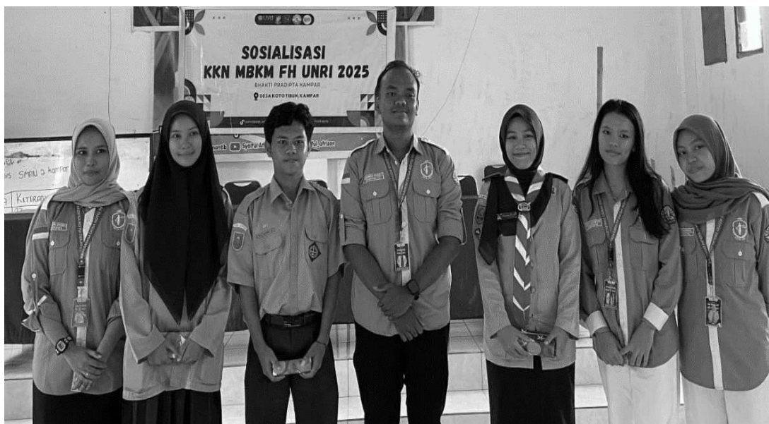
Gambar 7. Sesi Tanya jawab dan penyerahan hadiah kepada siswa

Sesi tanya jawab pada saat sosialisasi tentang pengelolaan sumber daya alam dan melestarikan hutan larangan adat berlangsung dengan interaktif dan penuh antusiasme. Para siswa terlihat aktif menjawab pertanyaan terkait materi. Pada saat sesi tanya jawab ini siswa tidak hanya mendapatkan pengetahuan juga menambahkan rasa percaya diri bagi siswa. Pada sesi terakhir sesi tanya jawab, mahasiswa KUKERTA MBKM FH UNRI memberikan hadiah sederhana kepada siswa yang bertanya dan menjawab pertanyaan tentang sosialisasi hukum sumber daya alam sebagai apresiasi.