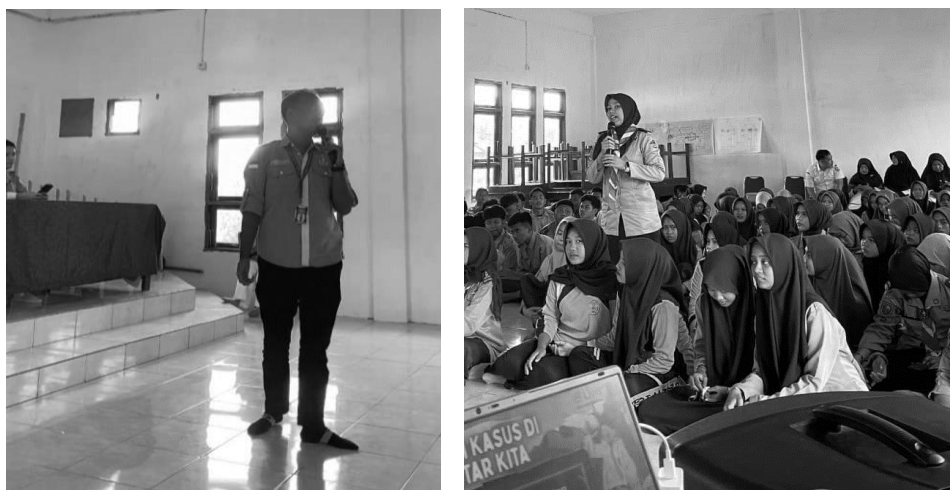
Gambar 5. Dokumentasi penyampaian materi

Penyampaian materi sosialisasi merupakan bagian inti dari kegiatan sosialisasi yang bertujuan untuk menyampaikan informasi, pengetahuan, atau panduan kepada peserta secara jelas, terstruktur, dan mudah dipahami. Bagian ini biasanya dilakukan oleh narasumber atau pihak yang berkompeten dalam topik yang dibahas, dengan tujuan memastikan peserta memahami substansi kegiatan dan dapat mengaplikasikan informasi yang diterima. Penyampaian materi disampaikan oleh dua orang pemateri. Pada pemateri pertama menjelaskan tentang apa yang dimaksud dengan hukum sumber daya alam. Tujuan dan peran pengelolaan sumber daya alam, dan pengaturan tentang hukum sumber daya alam. Sedangkan, pemateri kedua menjelaskan tentang pengelolaan sumber daya alam yang ada di Desa Koto Tibun dan tentang hutan lindung dan hutan larangan adat Ghimbo Potai .