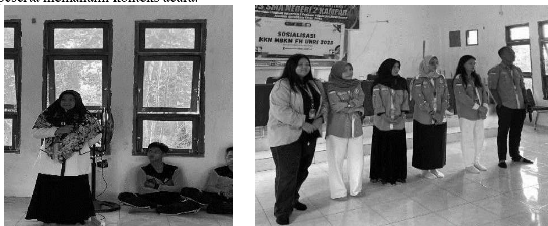
Gambar 4. Dokumentasi kata sambutan

Pembukaan sosialisasi moderator merupakan bagian awal dari kegiatan sosialisasi yang bertujuan untuk memperkenalkan tujuan, ruang lingkup, serta agenda kegiatan kepada peserta. Pembukaan ini disampaikan oleh moderator dengan bahasa yang jelas, lugas, dan menarik untuk menciptakan suasana yang kondusif serta memastikan peserta memahami konteks acara.