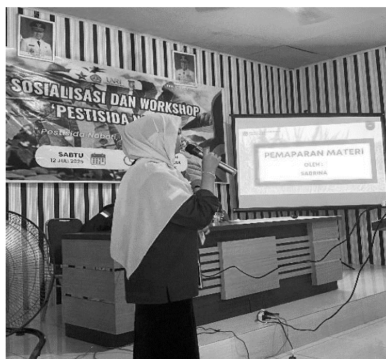
Gambar 2. Pemaparan Materi Sosialisasi oleh Tim KUKERTA UNRI