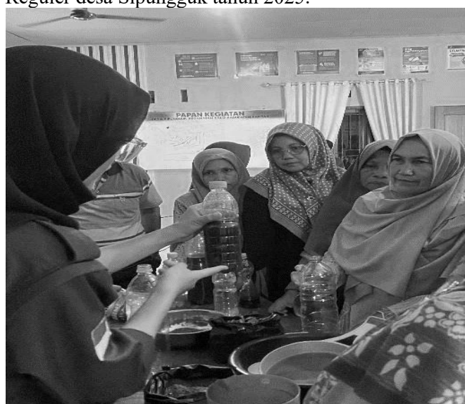
Gambar 3. Workshop dan Tanya Jawab oleh Tim KUKERTA UNRI

Setelah dilakukan praktik langsung dibuka sesi tanya jawab Audiens dapat memberikan pertanyaan maupun saran untuk kelompok KUKERTA Reguler desa Sipungguk tahun 2025.