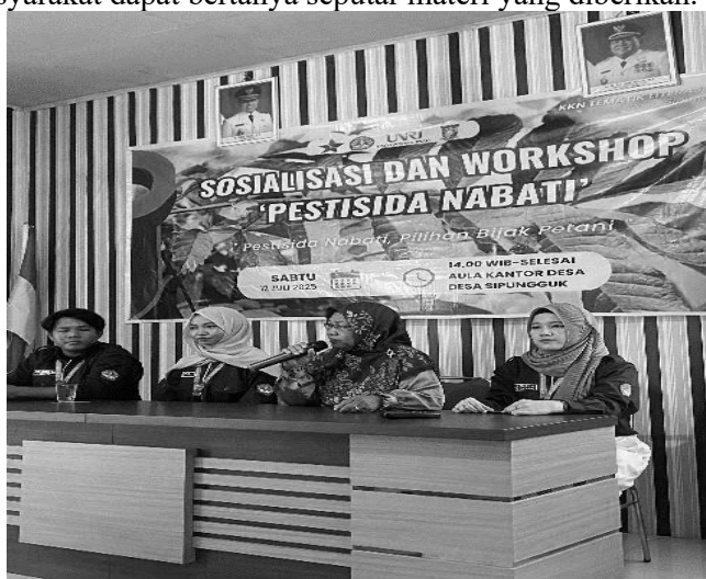
Gambar 1. Pembukaan Secara Resmi oleh Ketua BPP Kec. Salo

Sosialisasi dan workshop dilaksanakan pada sabtu Tanggal 12 Juli 2025 dan bertepatan di Aula Kantor Desa Sipungguk. Tahapan pelaksanaan terdiri dari (a) Sebelum melakukan kegiatan sosialisasi, kami memberikan sebuah buklet berisi tentang materi pestisida nabati, untuk mempermudah masyarakat dalam memahami materi yang diberikan, (b) Pembukaan acara secara resmi oleh Ketua BPP Kec. Salo, (c) Menyampaikan materi melalui presentasi oleh Tim KUKERTA, (d) Memulai workshop dengan mengajarkan cara mempersiapkan alat dan bahan, cara pembuatan, dan cara pengaplikasian pada tanaman padi. Pada saat melakukan kegiatan workshop dibuka sesi tanya jawab dengan tujuan agar masyarakat dapat bertanya seputar materi yang diberikan.