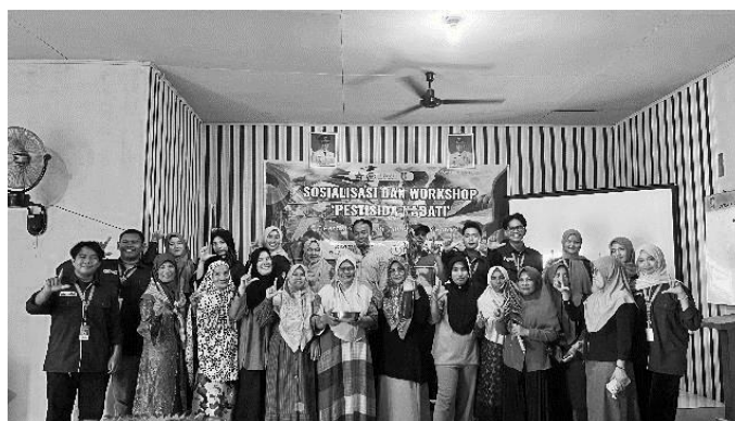
Gambar 4. Foto Bersama Setelah Sosialisasi

Hasil penelitian Saniah et al. , (2019), pemanfaatan ekstrak daun sungkai ( Peronema canescens Jacq.) yang diaplikasikan pada wereng coklat ( Nilaparvata lugens Stall) dengan konsentrasi 1% mampu mengendalikan wereng coklat dengan mortalitas 86,87% setelah 168 jam aplikasi. Menurut Siregar & Rustam (2022) bahwa pestisida nabati dikatakan efektif apabila dapat menyebabkan kematian hama \geq 80\% menggunakan pelarut organik dengan konsentrasi maksimal 1%.