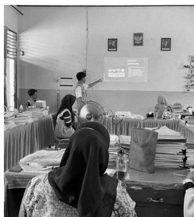
Gambar 6. Dokumentasi Penyampaian Hasil Observasi dan Arahan kepada Pihak Sekolah

Temuan ini sejalan dengan penelitian yang dilakukan oleh Putri dan Sari (2021) yang menegaskan bahwa program pencegahan bullying tidak dapat hanya mengandalkan keberadaan peraturan sekolah, tetapi juga harus melibatkan pendekatan partisipatif dan edukatif melalui pelatihan keterampilan sosial serta penguatan literasi emosi bagi siswa. Rendahnya kemampuan anak dalam mengenali dan mengelola emosi, ditambah lemahnya pengawasan guru, sering kali menjadi pemicu munculnya perilaku perundungan di lingkungan sekolah dasar. Sehingga kami memberikan beberapa arahan sederhana terkait strategi preventif terkait Bullying yang dapat diterapkan guru dalam aktivitas belajar mengajar sehari-hari, misalnya dengan meningkatkan pengawasan dan membangun komunikasi positif dengan siswa.