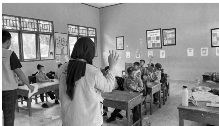
Gambar 4. Dokumentasi Mahasiswa Memberikan Arahan Pengisian Angket

Agar pengisian angket berjalan sesuai tujuan, mahasiswa kemudian memberikan arahan singkat kepada siswa. Penjelasan dilakukan menggunakan bahasa yang sederhana dan mudah dipahami. Kami juga memberikan kesempatan kepada siswa untuk bertanya apabila ada bagian yang dirasa membingungkan. Hal ini dilakukan agar jawaban yang diberikan siswa dapat mencerminkan kondisi sebenarnya.