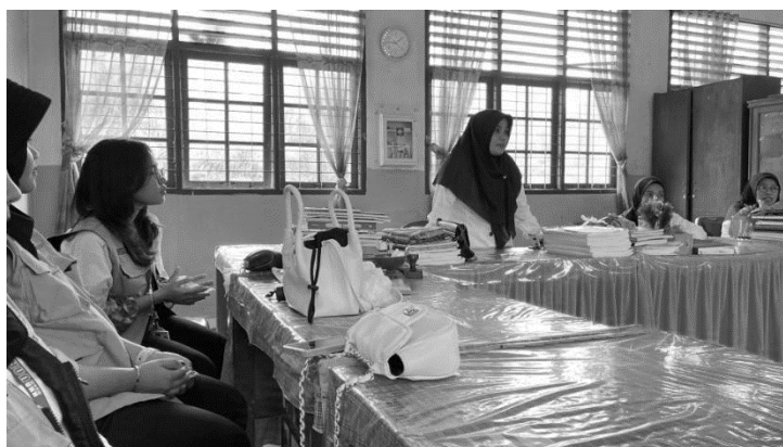
Gambar 2. Dokumentasi mahasiswa melakukan perkenalan singkat dan meminta izin kepada guru

Pada hari berikutnya, kami kembali datang untuk melakukan perkenalan singkat dengan guru-guru. Pertemuan ini tidak hanya bertujuan untuk menjalin komunikasi yang baik, tetapi juga menjadi kesempatan bagi kami untuk meminta izin kepada para guru sebelum melaksanakan kegiatan di kelas. Dengan adanya koordinasi ini, guru mengetahui secara jelas maksud kegiatan sehingga dapat memberikan dukungan penuh terhadap jalannya program.