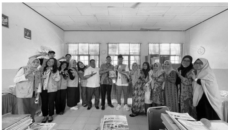
Gambar 7. Dokumentasi Penyerahan Kotak Aduan sebagai Langkah Preventif

Secara keseluruhan, rangkaian kegiatan yang dilaksanakan menunjukkan bahwa program KUKERTA Tematik Pencegahan Bullying mampu menumbuhkan kesadaran di lingkungan sekolah. Dengan adanya kegiatan ini, sekolah tidak hanya memiliki pemahaman yang lebih baik tentang kondisi siswa, tetapi juga memperoleh langkah preventif yang dapat diterapkan untuk mendukung tumbuh kembang anak secara optimal tanpa adanya rasa takut ataupun tekanan.