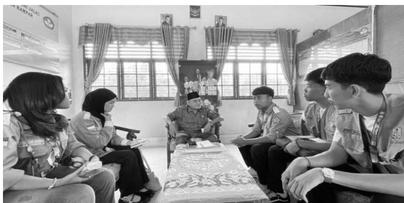
Gambar 1 Dokumentasi mahasiswa meminta izin kepada kepala sekolah SDN 011 Sungai Jalau

Tahap awal program ini diawali dengan kunjungan mahasiswa ke SDN 011 Sungai Jalau. Pada pertemuan pertama ini, kami secara langsung menemui Kepala Sekolah untuk menyampaikan maksud dan tujuan program. Selain meminta izin, kami juga menjelaskan garis besar rangkaian kegiatan yang akan dilaksanakan. Dukungan dari pihak sekolah menjadi langkah awal yang penting agar seluruh kegiatan dapat berjalan lancar.