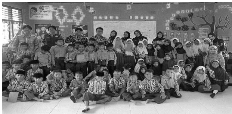
Gambar 1. Dokumentasi kunjungan ke sekolah.

Selain itu berdasarkan wawancara terhadap beberapa siswa dapat kami katakan, sebagian besar siswa sudah mengetahui apa itu bullying dan kekerasan seksual setelah mengikuti sosialisasi. Mereka dapat menjelaskan contoh perilaku yang termasuk dalam kategori tersebut, seperti mengejek teman, mengucilkan, memukul, atau menyentuh tanpa izin.