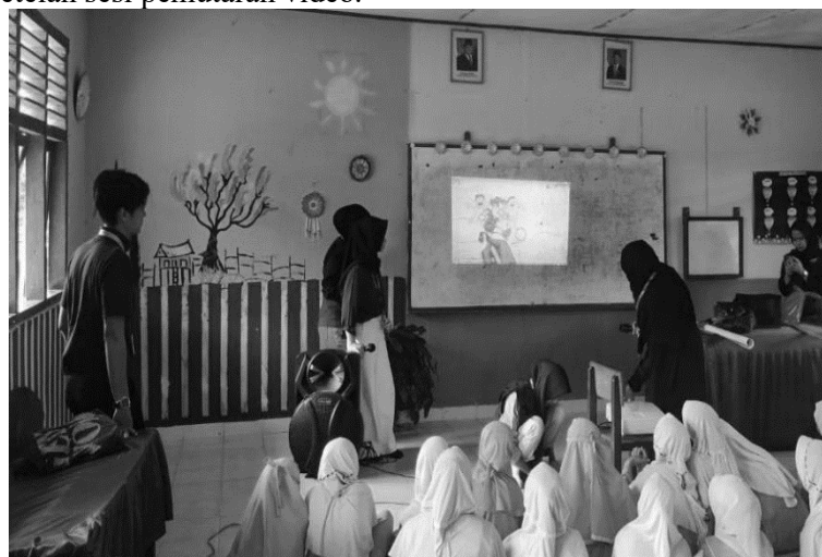
Gambar 3. Dokumentasi menonton video edukasi dan berinteraksi aktif dalam diskusi.

Selama melakukan sosialisasi, mahasiswa kukerta menayangkan video edukasi yang menampilkan simulasi situasi bullying dan kekerasan seksual yang sering terjadi di lingkungan sekolah. Tayangan ini menjadi sarana pemantik diskusi dan mengajak siswa untuk berpikir kritis serta memahami peran mereka dalam menciptakan lingkungan yang aman dan nyaman. Respon siswa sangat positif, mereka tampak antusias dan aktif dalam menjawab pertanyaan yang diajukan setelah sesi pemutaran video.