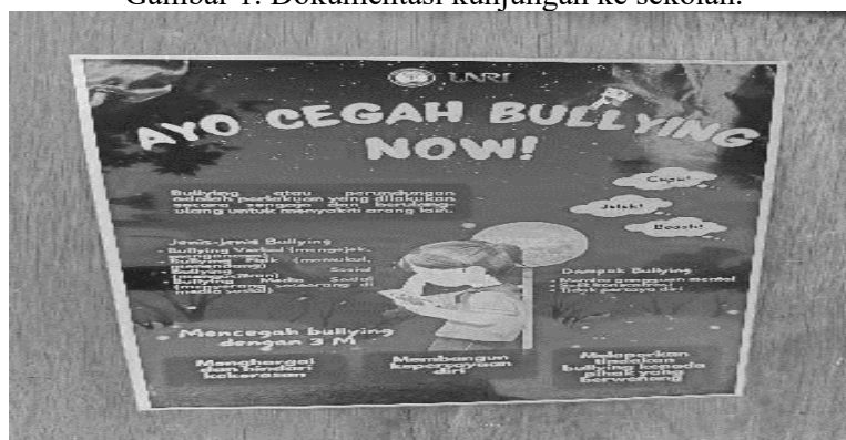
Gambar 2. Dokumentasi pemasangan poster edukatif.

Selama melakukan sosialisasi, mahasiswa kukerta menayangkan video edukasi yang menampilkan simulasi situasi bullying dan kekerasan seksual yang sering terjadi di lingkungan sekolah. Tayangan ini menjadi sarana pemantik diskusi dan mengajak siswa untuk berpikir kritis serta memahami peran mereka dalam menciptakan lingkungan yang aman dan nyaman. Respon siswa sangat positif, mereka tampak antusias dan aktif dalam menjawab pertanyaan yang diajukan setelah sesi pemutaran video.