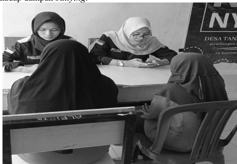
Gambar 3. Pendataan Pengalaman Siswa

Pada tahap diskusi, siswa diberikan kesempatan untuk mengungkapkan pengalaman pribadi atau pandangan mereka terkait bullying . Wawancara sederhana dilakukan untuk mendorong keberanian berbicara serta membangun empati terhadap sesama. Suasana yang hangat membuat siswa merasa lebih aman untuk berbagi pengalaman. Pendekatan ini sejalan dengan penelitian Nugroho & Azizah (2024) yang menegaskan bahwa metode wawancara reflektif efektif dalam membantu siswa mengidentifikasi perasaan dan pengalaman emosionalnya, sekaligus menumbuhkan kesadaran terhadap dampak bullying .