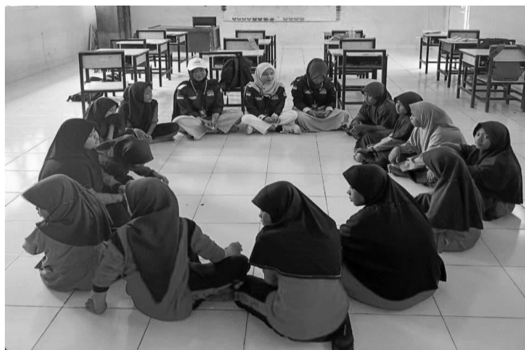
Gambar 2. Diskusi Kelompok dengan Siswa

Pada tahap diskusi, siswa diberikan kesempatan untuk mengungkapkan pengalaman pribadi atau pandangan mereka terkait bullying . Wawancara sederhana dilakukan untuk mendorong keberanian berbicara serta membangun empati terhadap sesama. Suasana yang hangat membuat siswa merasa lebih aman untuk berbagi pengalaman. Pendekatan ini sejalan dengan penelitian Nugroho & Azizah (2024) yang menegaskan bahwa metode wawancara reflektif efektif dalam membantu siswa mengidentifikasi perasaan dan pengalaman emosionalnya, sekaligus menumbuhkan kesadaran terhadap dampak bullying .