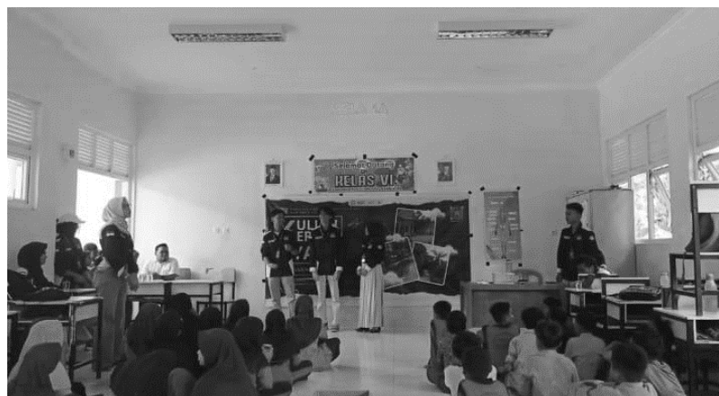
Gambar 5. Edukasi Anti-Bullying melalui Drama Edukatif

Sebagai bentuk inovasi program, mahasiswa memperkenalkan Kotak Hati Nurani sebagai media pelaporan rahasia bagi siswa yang ingin menyampaikan keluhan atau pengalaman terkait bullying . Meskipun hingga akhir kegiatan belum terdapat laporan yang masuk, Kotak Hati Nurani telah berfungsi sebagai simbol kesiapsiagaan sekolah dalam menampung aspirasi dan keluhan siswa secara aman dan etis. Guru juga menunjukkan antusiasme serta kesediaan untuk menindaklanjuti apabila ada laporan yang masuk di kemudian hari. Hal ini menunjukkan bahwa sistem pelaporan internal mulai terbentuk dan diterima secara positif oleh seluruh pihak sekolah. Temuan ini sejalan dengan Burns, Mayer, & Cornell (2022) yang menyatakan bahwa sistem pelaporan anonim merupakan salah satu strategi efektif dalam meningkatkan keberanian siswa melapor dan memperkuat budaya anti-kekerasan di lingkungan pendidikan.