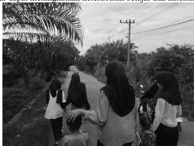
Gambar 10. Jalan Edukasi Sore

Mahasiswa mengajak anak-anak setempat jalan santai pada sore hari sebagai bagian dari jalan edukasi. Kegiatan ini bertujuan menumbuhkan keakraban dan kebersamaan, sekaligus menjadi media edukasi ringan di luar ruangan agar anak-anak lebih semangat belajar dengan cara yang menyenangkan. Hal ini sejalan dengan penelitian Cahyanto, Majid, Badaruddin, Dewi, Oktaviani, & Saleh (2023) yang menunjukkan bahwa pembelajaran di luar ruang dengan memanfaatkan lingkungan sekitar dapat meningkatkan keterlibatan belajar dan antusiasme siswa sekolah dasar.