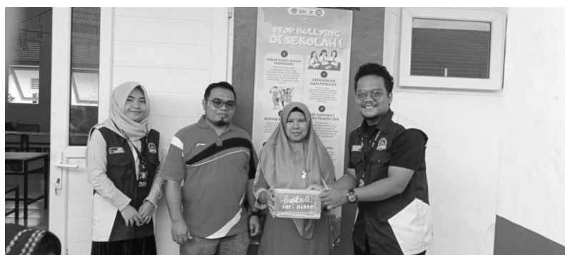
Gambar 6. Kotak Hati Nurani

Sebagai bentuk inovasi program, mahasiswa memperkenalkan Kotak Hati Nurani sebagai media pelaporan rahasia bagi siswa yang ingin menyampaikan keluhan atau pengalaman terkait bullying . Meskipun hingga akhir kegiatan belum terdapat laporan yang masuk, Kotak Hati Nurani telah berfungsi sebagai simbol kesiapsiagaan sekolah dalam menampung aspirasi dan keluhan siswa secara aman dan etis. Guru juga menunjukkan antusiasme serta kesediaan untuk menindaklanjuti apabila ada laporan yang masuk di kemudian hari. Hal ini menunjukkan bahwa sistem pelaporan internal mulai terbentuk dan diterima secara positif oleh seluruh pihak sekolah. Temuan ini sejalan dengan Burns, Mayer, & Cornell (2022) yang menyatakan bahwa sistem pelaporan anonim merupakan salah satu strategi efektif dalam meningkatkan keberanian siswa melapor dan memperkuat budaya anti-kekerasan di lingkungan pendidikan.