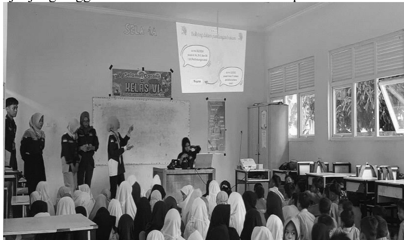
Gambar 1. Sosialisasi Interaktif Anti-Bullying

Program KKN MBKM Fakultas Hukum Universitas Riau Tahun 2025 di Desa Tanjung Rambutan menyelenggarakan sosialisasi anti- bullying di sekolah dasar sebagai upaya penanaman kesadaran hukum sejak dini. Materi kegiatan memuat pembahasan bahwa tindakan bullying terhadap anak merupakan pelanggaran hukum sebagaimana diatur dalam Undang-Undang Nomor 35 Tahun 2014 tentang Perlindungan Anak dan Undang-Undang Nomor 11 Tahun 2012 tentang Sistem Peradilan Pidana Anak. Hal ini sejalan dengan temuan Rifla & Saputra (2025) bahwa “UU No. 35 Tahun 2014 menyebut bahwa anak di lingkungan pendidikan berhak mendapatkan perlindungan dari kekerasan fisik dan psikologis termasuk bullying , tapi implementasi regulasi tersebut di sekolah-sekolah masih memiliki banyak hambatan.” Kegiatan ini diharapkan mampu mendorong terciptanya lingkungan sekolah yang aman, ramah anak, serta menjunjung tinggi nilai kemanusiaan dan martabat peserta didik.