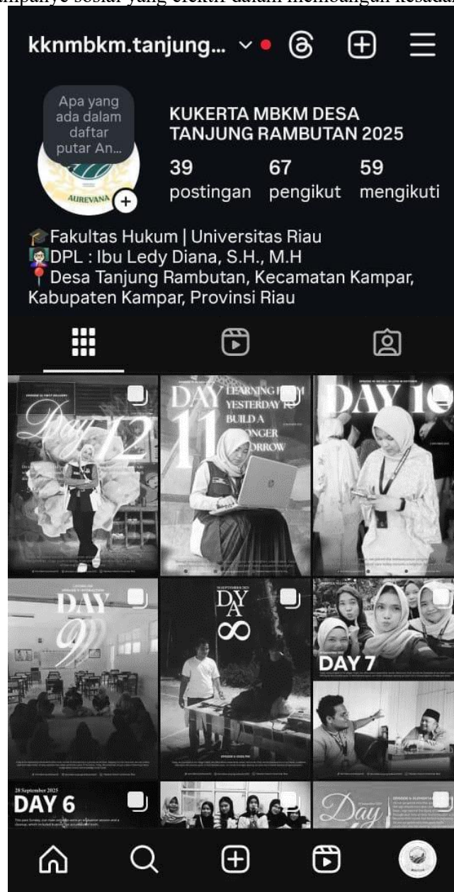
Gambar 8. Glorifikasi Kegiatan Anti-Bullying

bullying . Hal ini sejalan dengan pandangan Nasrullah (2017) yang menegaskan bahwa media sosial berperan sebagai ruang komunikasi publik dan kampanye sosial yang efektif dalam membangun kesadaran kolektif.