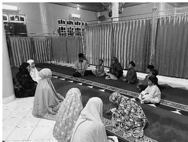
Gambar 9. Kegiatan Belajar Mengajar Mengaji di Masjid

Mahasiswa mengajak anak-anak setempat jalan santai pada sore hari sebagai bagian dari jalan edukasi. Kegiatan ini bertujuan menumbuhkan keakraban dan kebersamaan, sekaligus menjadi media edukasi ringan di luar ruangan agar anak-anak lebih semangat belajar dengan cara yang menyenangkan. Hal ini sejalan dengan penelitian Cahyanto, Majid, Badaruddin, Dewi, Oktaviani, & Saleh (2023) yang menunjukkan bahwa pembelajaran di luar ruang dengan memanfaatkan lingkungan sekitar dapat meningkatkan keterlibatan belajar dan antusiasme siswa sekolah dasar.