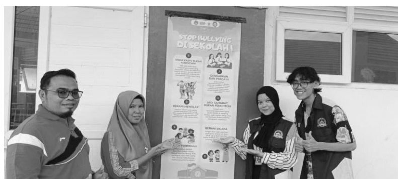
Gambar 7. Kolaborasi Pengawasan dan Penerapan Anti-Bullying dengan Guru SD

Mahasiswa bersama guru berkolaborasi dalam pembuatan poster anti-bullying yang menampilkan pesan edukatif sederhana dan mudah dipahami oleh anak-anak. Poster ini diharapkan dapat menjadi media belajar berkelanjutan yang memperkuat nilai anti-bullying serta menjadi pengingat visual di lingkungan sekolah. Kolaborasi ini juga memperkuat keterlibatan guru dalam proses pencegahan perundungan secara mandiri setelah kegiatan KKN berakhir.