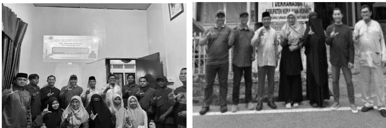
Gambar 4. Foto Bersama Antara Peserta, Tim Pengabdian, Dan Mitra Instansi Pemerintah Daerah

Kedua, kegiatan ini berhasil membangun jejaring strategis antara masyarakat, pelaku ekspor, serta instansi pemerintah daerah seperti Disperindag dan Perkim LH. Jejaring ini memperkuat potensi pengembangan industri briket arang sagu di masa depan. Gambar 4 menunjukkan momen foto bersama antara peserta, tim pengabdian, dan mitra instansi pemerintah daerah sebagai simbol kolaborasi.