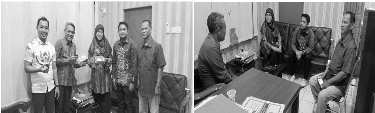
Gambar 5 Sesi diskusi reflektif dengan Kepala Dinas Perindustrian dan Perdagangan

Tahap terakhir kegiatan ini adalah berupa monitoring dan evaluasi yang dilakukan melalui kuesioner kepuasan peserta serta diskusi tindak lanjut pengembangan usaha briket arang sagu selama 3 bulan pendampingan hingga bulan November 2025.