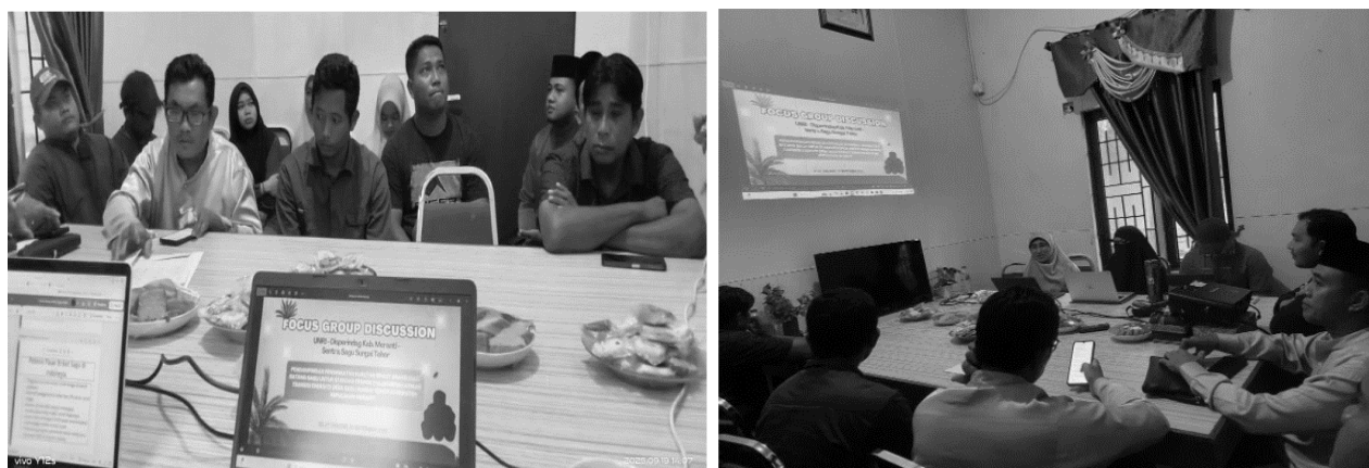
Gambar 1. Focus Group Discussion dan Sosialisasi Program

Pelaksanaan kegiatan pengabdian diawali dengan Focus Group Discussion (FGD) yang dilaksanakan di Selat Panjang pada 18–21 September 2025. Kegiatan ini diikuti oleh 20 peserta yang berasal dari Disperindag, Perkim LH, Sentra Sagu, Kilang Sagu Lalang, serta BUMDes setempat. Pada sesi FGD, narasumber dari Ecotohor Solution memberikan pemaparan mengenai peluang pasar briket arang sagu di tingkat global. Suasana kegiatan berlangsung interaktif, peserta aktif bertanya dan mendiskusikan strategi agar produk briket arang sagu dapat memenuhi standar ekspor. Gambar 1 menampilkan suasana FGD yang berlangsung interaktif antara peserta dan narasumber.