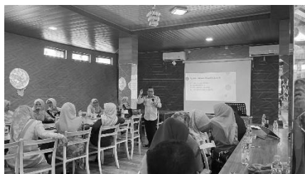
Gambar 1. Focus Group Discussion

Kegiatan pengabdian diawali dengan melakukan FGD yang bertujuan untuk menjelaskan alur pengabdian kepada mitra. Kegiatan ini juga dilakukan untuk mempersiapkan materi dan instrumen yang akan digunakan saat kegiatan pengabdian masyarakat dilaksanakan. FGD dilakukan dengan melibatkan dosen, anggota pengabdian, kepala sekolah dan guru.