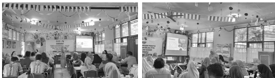
Gambar 2. Pelatihan

Pada Gambar 3 terlihat bahwa para guru menunjukkan antusiasme yang sangat tinggi dalam mengikuti pelatihan praktik Penelitian Tindakan Kelas (PTK). Antusiasme tersebut tercermin melalui keaktifan peserta dalam mengajukan pertanyaan, berdiskusi, serta menggali informasi secara lebih mendalam mengenai penerapan PTK di kelas. Keaktifan para guru tidak hanya menunjukkan rasa ingin tahu yang besar, tetapi juga menandakan adanya kesadaran akan pentingnya PTK sebagai salah satu upaya untuk meningkatkan kualitas pembelajaran. Partisipasi aktif ini menggambarkan komitmen guru untuk terus mengembangkan kompetensi profesionalnya sehingga mampu merancang, melaksanakan, dan mengevaluasi pembelajaran secara lebih efektif dan berkesinambungan. Dengan demikian, antusiasme yang ditunjukkan para peserta menjadi indikator positif bahwa pelatihan ini relevan dengan kebutuhan mereka serta berpotensi memberikan dampak nyata terhadap peningkatan mutu pendidikan di sekolah dasar.