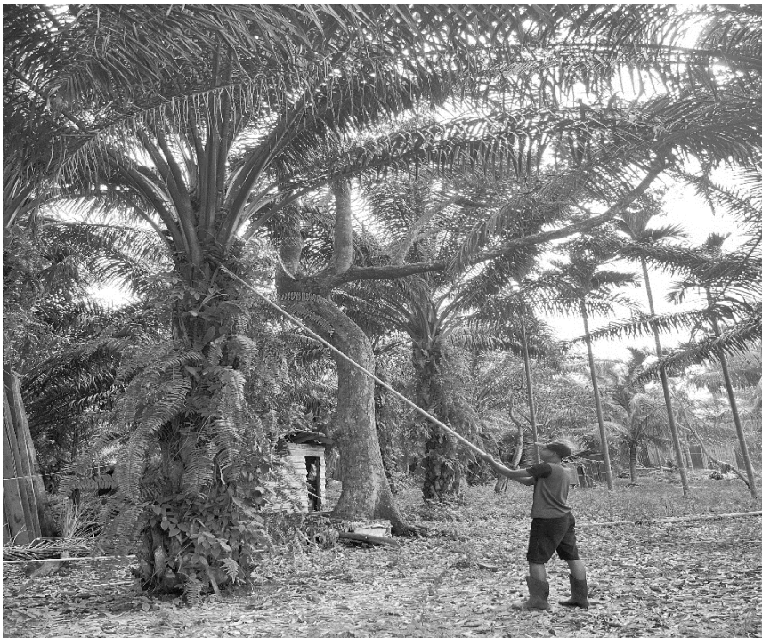
Gambar 1. Petani kelapa sawit yang sedang memanen buah

Pekerja informal sering kali tidak terlindungi oleh sistem ketenagakerjaan formal dan tidak tercakup dalam program jaminan sosial seperti BPJS Ketenagakerjaan. Hal ini mengakibatkan lemahnya perlindungan hukum atas hak-hak dasar mereka, termasuk keselamatan kerja. Oleh karena itu, perlu adanya intervensi hukum berbasis komunitas yang menyorot kelompok rentan ini.