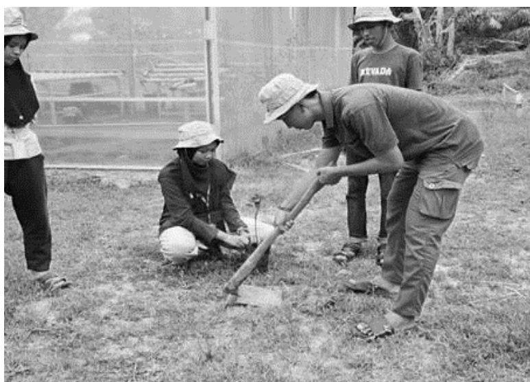
Gambar 4. Kegiatan penanaman tanaman MPTS

Kegiatan kedua yang dilaksanakan adalah penanaman pohon pelindung dan produktif jenis MPTS (Multi Purpose Tree Species). Jenis tanaman yang ditanam antara lain jeruk, nangka, alpukat, matoa, petai, kelapa, kelengkeng, dan kedondong. Tanaman MPTS tidak hanya bernilai ekonomi tetapi juga memiliki fungsi ekologis sebagai peneduh, pelindung tanah dari erosi, serta penyeimbang kelembaban mikro di sekitar lahan (Nair et al., 2019). Proses penanaman dilakukan di lahan kosong yang sebelumnya tidak tertanam maupun di sekitar kolam. Mahasiswa secara aktif menggali lubang tanam, mengatur jarak tanam, dan berkomitmen melakukan penyiraman dan pemupukan secara berkala. Melalui kegiatan ini, diharapkan dalam jangka menengah, masyarakat tidak hanya mengandalkan satu jenis komoditas musiman, tetapi juga memiliki sumber pendapatan alternatif yang lebih stabil dan ramah lingkungan. kegiatan penanaman tanaman MPTS dapat dilihat pada Gambar 4 dibawah ini.