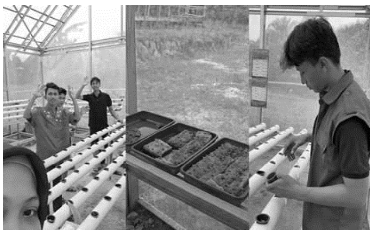
Gambar 5. Kegiatan pengaktifan kembali instalasi hidroponik

desa. Adanya interaksi yang intens antara mahasiswa dan masyarakat memungkinkan terciptanya alih teknologi dan pengetahuan secara timbal balik. Di satu sisi, mahasiswa mendapatkan pengalaman lapangan yang kaya dan kompleks, sedangkan di sisi lain, masyarakat memperoleh pemahaman baru yang dapat diterapkan secara mandiri setelah program berakhir.