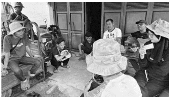
Gambar 1. Kegiatan identifikasi dan kebutuhan desa

Kegiatan pengembangan sistem pertanian terpadu di Desa Dayun diawali dengan proses identifikasi potensi melalui metode observasi langsung, wawancara dengan tokoh masyarakat dan petani lokal, serta Focus Group Discussion (FGD) yang melibatkan unsur masyarakat dan pemerintah desa. Proses ini dilaksanakan selama minggu pertama program KKN untuk memastikan kegiatan yang dirancang benar-benar berbasis pada kondisi dan kebutuhan lokal.