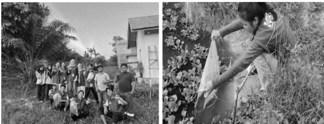
Gambar 3. Optimalisasi kolam ikan dengan penebaran ikan

Kegiatan kedua yang dilaksanakan adalah penanaman pohon pelindung dan produktif jenis MPTS (Multi Purpose Tree Species). Jenis tanaman yang ditanam antara lain jeruk, nangka, alpukat, matoa, petai, kelapa, kelengkeng, dan kedondong. Tanaman MPTS tidak hanya bernilai ekonomi tetapi juga memiliki fungsi ekologis sebagai peneduh, pelindung tanah dari erosi, serta penyeimbang kelembaban mikro di sekitar lahan (Nair et al., 2019). Proses penanaman dilakukan di lahan kosong yang sebelumnya tidak tertanam maupun di sekitar kolam. Mahasiswa secara aktif menggali lubang tanam, mengatur jarak tanam, dan berkomitmen melakukan penyiraman dan pemupukan secara berkala. Melalui kegiatan ini, diharapkan dalam jangka menengah, masyarakat tidak hanya mengandalkan satu jenis komoditas musiman, tetapi juga memiliki sumber pendapatan alternatif yang lebih stabil dan ramah lingkungan. kegiatan penanaman tanaman MPTS dapat dilihat pada Gambar 4 dibawah ini.