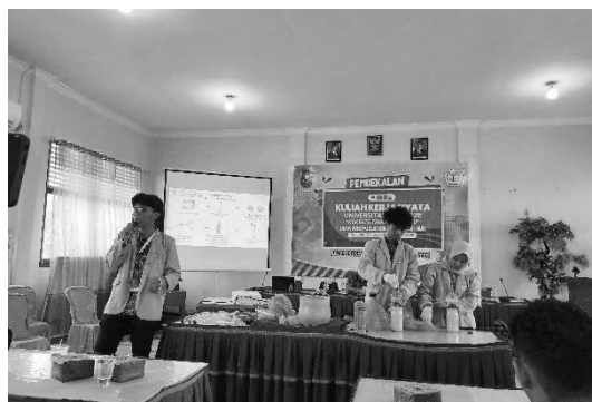
Gambar 4. Demonstrasi pembuatan ekoproduct

Demonstrasi dilakukan untuk memperlihatkan proses pembuatan ekoproduct secara langsung. Pembuatan POC dimulai dengan mengendapkan air cucian beras selama beberapa hari hingga terjadi fermentasi alami. Sementara itu, pot tanaman dibuat dengan cara memotong botol plastik bekas, melubangi bagian bawah untuk drainase, dan menghias bagian luar untuk meningkatkan daya tarik. Peserta diberikan kesempatan praktik langsung untuk meningkatkan keterampilan dan pemahaman mereka.