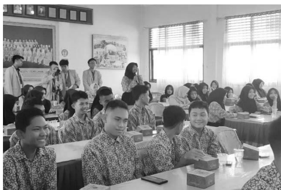
Gambar 5. Sesi diskusi

Setelah sesi edukasi dan demonstrasi, dilakukan sesi tanya jawab untuk mengukur keterlibatan dan pemahaman peserta secara langsung. Dalam sesi ini, beberapa siswa menunjukkan antusiasme tinggi dengan mengajukan pertanyaan kritis seputar pemanfaatan limbah rumah tangga menjadi produk ramah lingkungan. Sesi ini juga menjadi indikator awal bahwa kegiatan telah mendorong rasa ingin tahu serta pemahaman siswa terhadap isu lingkungan dan solusi aplikatifnya.