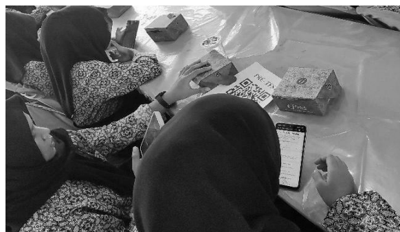
Gambar 1. Siswa/i sedang melaksanakan pre-test