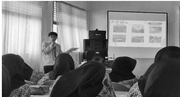
Gambar 3. Pemaparan dampak sampah bagi lingkungan