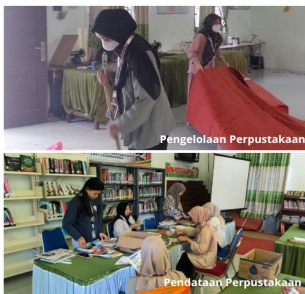
Gambar 1. Dokumentasi Pengelolaan & Pendataan Perpustakaan

Optimalisasi layanan perpustakaan disertai pembukaan jam kunjungan rutin dan pendampingan penggunaan sistem digital bagi pengunjung, sehingga perpustakaan tidak hanya menjadi ruang penyimpanan buku, tetapi pusat aktivitas belajar masyarakat.