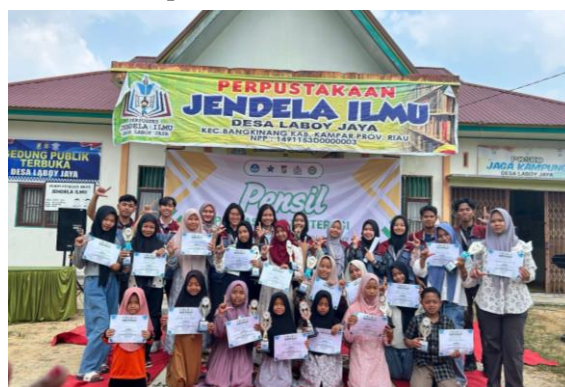
Gambar 5. Dokumentasi apresiasi literasi tingkat Desa

Sebagai puncak kegiatan, dilaksanakan apresiasi literasi tingkat desa berupa pentas seni, lomba mading, dan pameran karya literasi anak. Momentum ini menjadi ruang publik yang mendorong partisipasi masyarakat, mengapresiasi hasil karya anak-anak, dan memperkuat identitas kultural berbasis literasi.