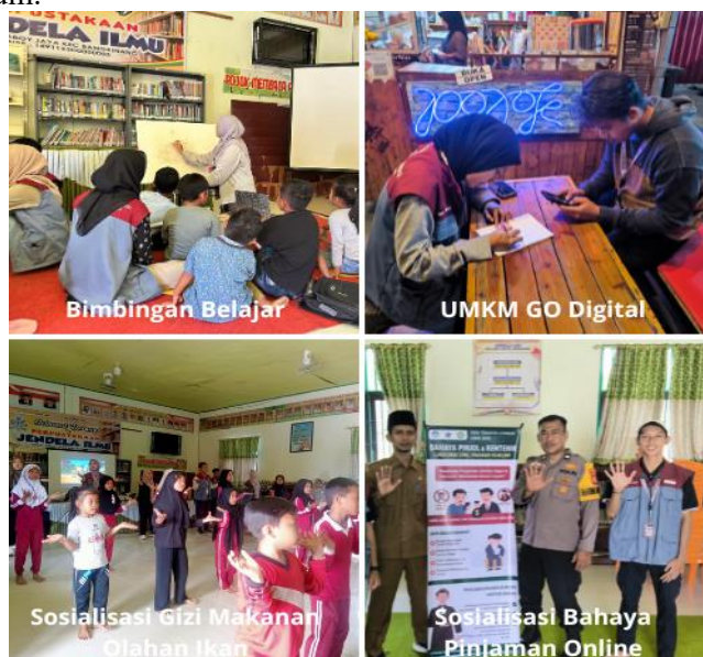
Gambar 7. Dokumentasi Kegiatan Pendukung Literasi Fungsional

Selain fokus pada literasi dasar, program ini juga mencakup literasi fungsional melalui kegiatan pendukung seperti bimbingan belajar matematika, sosialisasi gizi melalui senam Gemar Makan Ikan, pelatihan UMKM Go Digital, dan edukasi bahaya pinjaman online. Hal ini memperluas makna pendidikan berkualitas mencakup dimensi kesehatan, ekonomi, dan hukum.