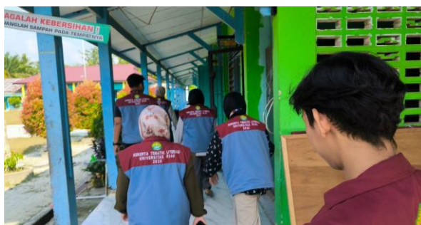
Gambar 4. Kunjungan literasi ke Sekolah

Pendekatan literasi ini diperluas melalui kegiatan kunjungan literasi ke sekolah, di mana mahasiswa KUKERTA berperan sebagai agen literasi yang membantu guru menciptakan atmosfer kelas yang kreatif dan interaktif. Kegiatan ini memperkuat hubungan antara instansi pendidikan di Desa Laboy Jaya.