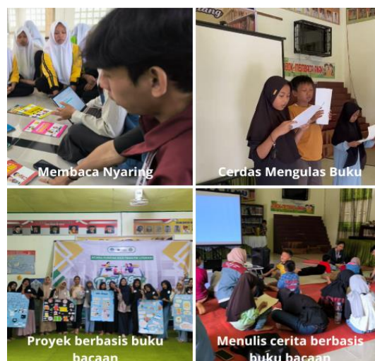
Gambar 3. Dokumentasi Kegiatan Literasi Kreatif

Pendekatan literasi ini diperluas melalui kegiatan kunjungan literasi ke sekolah, di mana mahasiswa KUKERTA berperan sebagai agen literasi yang membantu guru menciptakan atmosfer kelas yang kreatif dan interaktif. Kegiatan ini memperkuat hubungan antara instansi pendidikan di Desa Laboy Jaya.