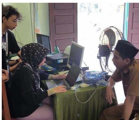
Gambar 2. Dokumentasi Pelayanan Perpustakaan

Optimalisasi layanan perpustakaan disertai pembukaan jam kunjungan rutin dan pendampingan penggunaan sistem digital bagi pengunjung, sehingga perpustakaan tidak hanya menjadi ruang penyimpanan buku, tetapi pusat aktivitas belajar masyarakat.