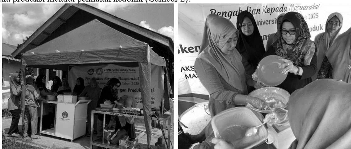
Gambar 1. Pendampingan diversifikasi makaroni ikan aneka rasa

Produk makaroni ini memberikan sebuah inovasi bagi sebagian orang yang tidak mampu mengkonsumsi ikan secara langsung, maka dapat menikmati kandungan dan gizi ikan dari snack makaroni ini. Pengkayaan produk dengan penambahan ikan mampu menaikkan sektor perikanan dan UMKM menjadi lebih baik. Pemanfaatan ikan dalam produksi UMKM akan berdampak positif, karena Riau terkhususnya merupakan salah satu provinsi penghasil perikanan budidaya terbesar yaitu berkisar 40-50 ton perhari (Junaidi, 2021). Selain pembuatan makaroni, juga adanya pemberian varian aneka rasa dengan tambahan bumbu taburan seperti jagung bakar, BBQ, dan balado. Pemberian aneka rasa ini memberikan daya tarik pada konsumen untuk memilih varian rasa yang disukai dan meningkatkan keterampilan mitra dalam memproduksi produk yang bervariasi sehingga keterampilan mitra tidak menoton. Secara umum, kelompok Mastali Madu sangat menyukai produk snack makaroni ikan aneka rasa yang telah mereka produksi melalui penilaian hedonik (Gambar 2).