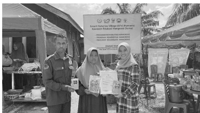
Gambar 4. Penyerahan izin edar P-IRT dan NIB

Pemberdayaan yang dilakukan salah satunya dengan membantu dalam pembuatan izin P-IRT dan NIB agar produk yang ada dikelompok ini mampu dipasarkan lebih luas. P-IRT (Pangan Industri Rumah Tangga) merupakan izin edar yang berfungsi dalam pelegalitasan produk pangan, agar mampu dipasarkan secara meluas. Sedangkan, NIB merupakan Nomor Induk Berusaha sebagai identitas resmi bagi pelaku usaha di Indonesia. Adanya izin edar berupa P-IRT dan NIB memberikan kepercayaan konsumen terhadap produk yang dipasarkan, sehingga Kelompok Mastali Madu akan semakin mudah dalam mengembangkan usahanya terutama dalam memanfaatkan potensi yang ada.