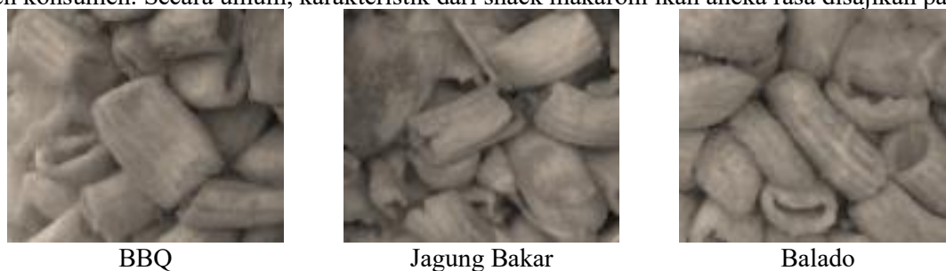
Gambar 3. Penampakan snack makaroni ikan aneka rasa

bahwa rasa merupakan parameter penting dalam makanan untuk mengetahui apakah produk disukai dan dapat diterima oleh konsumen. Secara umum, karakteristik dari snack makaroni ikan aneka rasa disajikan pada Tabel 1.