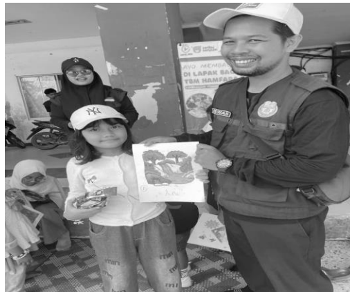
Gambar 5. Apresiasi lomba

Melalui wawancara informal dengan anak-anak dan orang tua, diperoleh data bahwa sebagian besar anak mengaku merasa senang dan tertarik untuk datang kembali ke Lapak Baca di CFD. Banyak anak yang awalnya hanya bermain, kemudian tertarik untuk membaca buku atau mengikuti permainan edukatif. Selain itu, kegiatan seperti lomba mewarnai terbukti meningkatkan rasa percaya diri anak karena memberikan mereka ruang untuk mengekspresikan kreativitas dan mendapatkan apresiasi atas hasil karya mereka. Apresiasi biasanya diberikan dalam bentuk susu dan makanan ringan.