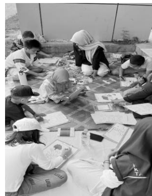
Gambar 3. Kegiatan edukatif literasi di CFD

Lapak Baca yang dibangun di area CFD menyediakan lebih dari 50 buku bacaan anak yang bervariasi, mulai dari cerita rakyat, buku bergambar, komik edukatif, hingga ensiklopedia sederhana dengan judul yang berbeda beda di tiap minggunya. Permainan edukatif seperti puzzle, kartu gambar, dan papan kuis tematik juga disediakan untuk melatih keterampilan kognitif anak secara menyenangkan. Dalam permainan, anak anak bermain bersama bersama yang juga didampingi Mahasiswa KKN. Alat alat mewarnai semua lengkap disediakan oleh Mahasiswa KKN.