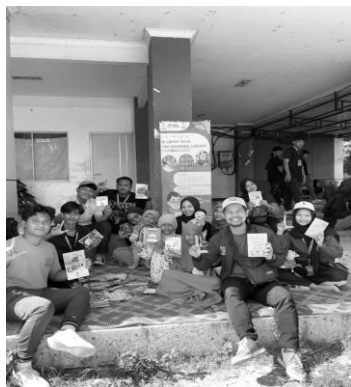
Gambar 2. Penyediaan sarana Literasi