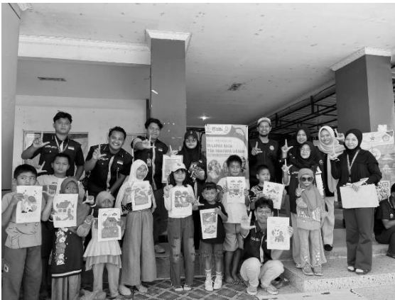
Gambar 4. Lomba mewarnai Anak