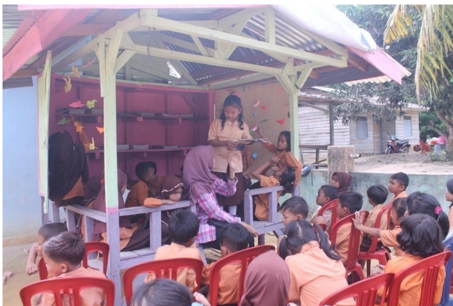
Gambar 2. Kegiatan di pondok literasi

Seperti yang telah dijelaskan, dalam perencanaan pembangunan, dari kacamata sosiologi, pengembangan pendidikan haruslah menjadikan manusia sebagai pusatnya. Sederhananya, pembangunan harus menyesuaikan kebutuhan manusia sehingga tepat sasaran dan dapat dimanfaatkan masyarakat. Tidak hanya bangunan fisik, melainkan juga dalam hal non fisik. Pondok literasi memang menarik bagi siswa/i, namun penulis pun menekankan kegiatan yang juga dekat dengan siswa/i dan masyarakat setempat.