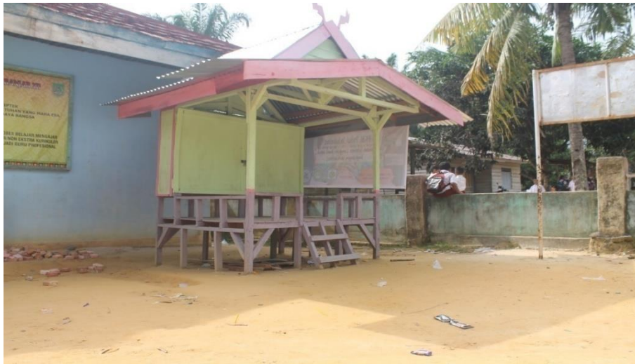
Gambar 1. Pondok Literasi

Junction khususnya sejak dahulu mengenal pondok sebagai media berkumpul, bincang, bermain bagi anak-anak dan lain sebagainya.