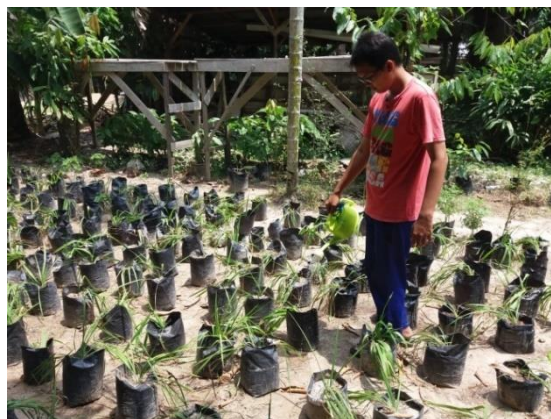
Gambar 4. Pengadaan bibit BADAK