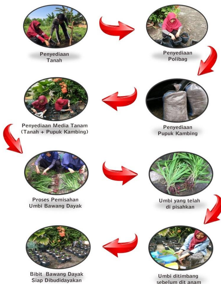
Gambar. 1. Tahapan Kegiatan Budidaya BADAk

Budidaya bawang dayak perlu dilakukan oleh masyarakat karena proses penanganan yang mudah. Adapun tahapan budidaya BADAk dan pemanfaatannya adalah sebagai berikut.