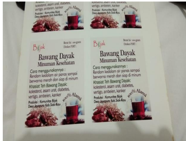
Gambar 5. Kemasan Teh BADAQ