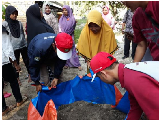
Gambar 3. Pengadaan pupuk Kompos

Langkah strategis yang dilakukan adalah intensif melakukan pembinaan pada 20 orang peserta yang berpartisipasi dalam membudidayakan melalui pendampingan pada kegiatan di lapangan budidaya serta memantau kendala-kendala dan memotivasi peserta dalam meningkatkan pengadaan bibit bawang dayak dengan melatih pembuatan pupuk kompos dari TANKOS sawit dan pembibitan (Gambar 3 dan Gambar 4).