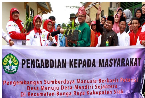
Gambar 6. Tim Pengabdian Bersama Camat