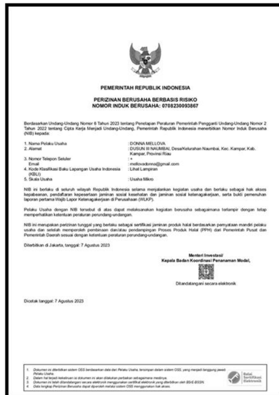
Gambar 5. Contoh NIB Salah Satu Pelaku Usaha Palito Daun

NIB (Nomor Induk Berusaha) adalah identifikasi usaha yang digunakan oleh pelaku usaha untuk memperoleh izin usaha serta izin komersial atau operasional, termasuk untuk memenuhi persyaratan dalam perizinan usaha dan operasional (Hartono et al., 2020). Maksudnya, dengan NIB, pelaku usaha tidak perlu lagi mengurus 3 (tiga) persyaratan izin usaha tersebut. Lewat registrasi Nomor Induk Berusaha (NIB).