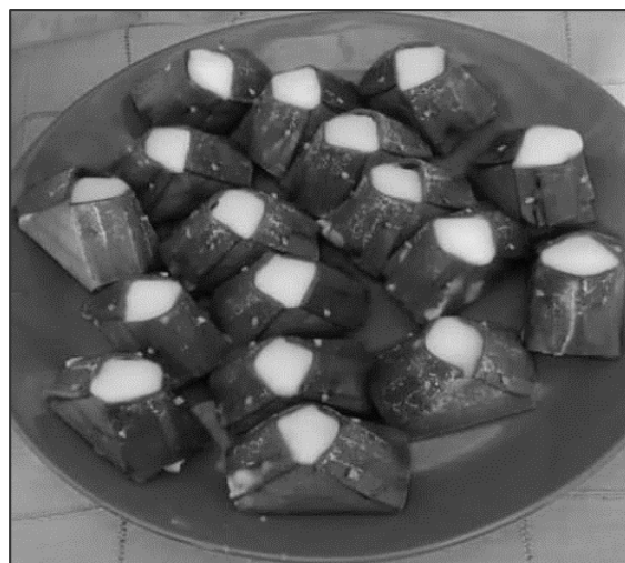
Gambar 1. Palito Daun Kampar

Palito daun adalah makanan khas daerah Provinsi Riau dari Kabupaten Kampar. Bahan utamanya adalah tepung beras, bentuknya persegi warna kue bagian atas putih diletakkan diatas daun pisang kue ini bahan- bahannya sama dengan kue talam , lemang basuong , tetapi bentuk dan cara mengolahnya yang berbeda . kue ini dikatakan kue palito daun adalah apabila kita buka daun pisangnya maka bagian bawah dari kue ini seperti sumbu palito. Sumbu ini terbuat dari gula enau yang dipotong – potong (Saputra, 2013).