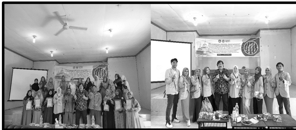
Gambar 3. Sosialisasi Legalitas dan Pemasaran

Sebelum kegiatan ini dilaksanakan, hanya 3 (tiga) orang pelaku usaha yang tertarik untuk mengurus legalitas usahanya, namun dengan mengikuti sampai akhir minta pelaku usaha bertambah menjadi 15 (lima belas) orang. Kegiatan ini dinilai sangat berhasil sebab meningkatkan kesadaran pelaku usaha untuk segera memiliki legalitas usahanya, yaitu berupa nomor induk berusaha (NIB).