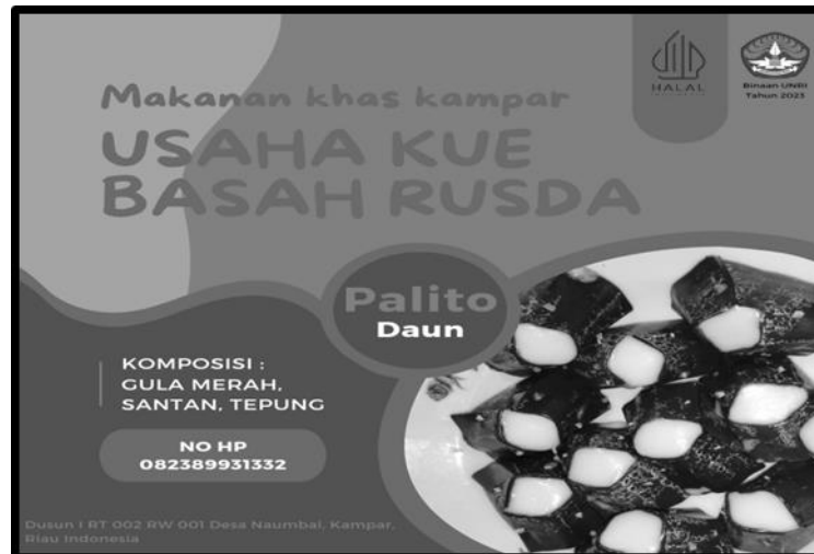
Gambar 5. Sticker Pelaku Usaha Palito Daun

Pada langkah ini, tim yang terlibat dalam kegiatan pengabdian kepada masyarakat memberikan penyuluhan mengenai signifikansi desain sticker kemasan dalam sektor industri rumah tangga kepada para pemangku kepentingan industri. Mereka menggambarkan pentingnya kemasan sebagai elemen yang sangat penting dalam konteks produk. Kemudian, tim pengabdian kepada masyarakat bekerja bersama-sama dengan para pelaku industri untuk mengembangkan konsep dan pesan baru untuk desain kemasan mereka, ataupun disesuaikan dengan kebutuhan para pelaku.