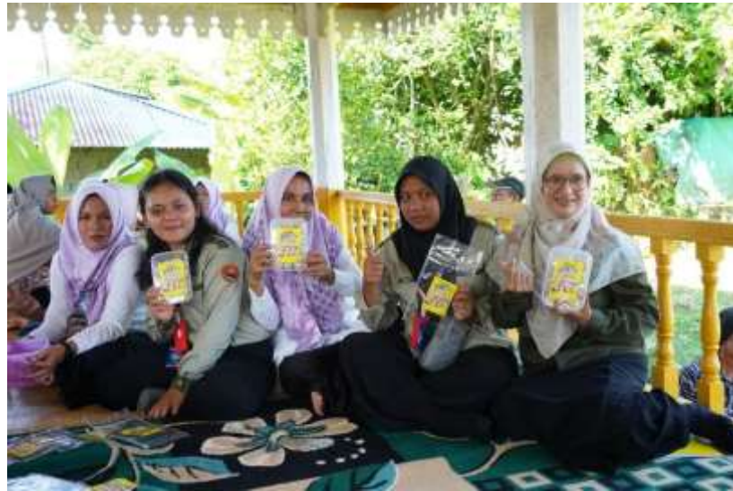
Gambar 3. Praktek Pacakaging Produk Masyarakat Desa Koto Benai

Pemberdayaan juga dapat didefinisikan setiap orang memperoleh pemahaman dan pengendalian kekuatan sosial, ekonomi, dan/atau politik untuk memperbaiki keberadaannya di masyarakat (Sifa et al., 2022). Program pengembangan produk lokal menghasilkan kemasan-kemasan dari olahan produk lokal masyarakat Desa Koto Benai (Gambar 4).