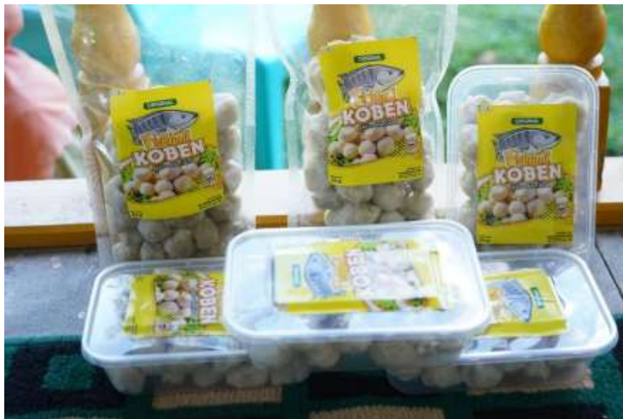
Gambar 4. Hasil Kemasan Produk Masyarakat Desa Koto Benai

Pemberdayaan juga dapat didefinisikan setiap orang memperoleh pemahaman dan pengendalian kekuatan sosial, ekonomi, dan/atau politik untuk memperbaiki keberadaannya di masyarakat (Sifa et al., 2022). Program pengembangan produk lokal menghasilkan kemasan-kemasan dari olahan produk lokal masyarakat Desa Koto Benai (Gambar 4).