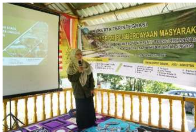
Gambar 1. Kegiatan Pengabdian Kepada Masyarakat

Kegiatan Pengabdian Kepada Masyarakat di Desa Koto Benai dalam Program Pemberdayaan Masyarakat Dalam Pengembangan Ekonomi Kreatif Bidang Perikanan dan Pariwisata di Desa Koto Benai Kabupaten Kuantan Singingi merupakan kegiatan lanjutan tahun ke dua. Program tahun kedua ini berfokus pada pengembangan produk lokal. Kegiatan ini telah dilakukan pada bulan Juli – Agustus 2023 dan akan diakhiri dengan kegiatan monitoring dan evaluasi diakhir program.