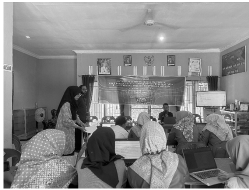
Gambar 3. Pendampingan Pelatihan oleh Fasilitator