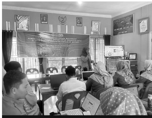
Gambar 4. Pemberian Materi oleh Mahasiswa KKN

Setelah pelatihan, tim melakukan evaluasi untuk mengukur efektivitas kegiatan. Evaluasi dilakukan dengan menggunakan kuisioner yang diberikan sebelum dan sesudah pelatihan. Hasil kuisioner yang diberikan sebelum dan sesudah pelatihan menunjukkan peningkatan yang signifikan dalam pemahaman peserta terhadap penggunaan fitur-fitur lanjutan microsoft office . Grafik 1 menunjukkan peningkatan pemahaman aparat desa dalam menggunakan Microsoft Office sebesar 28% dengan hasil pretest sebesar 50% dan hasil post-test mencapai 78%.