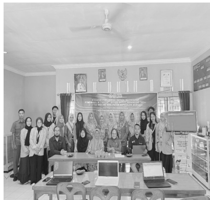
Gambar 1. Foto Bersama

Kendala dalam pelatihan ini adalah durasi pelatihan yang hanya satu hari. Dalam waktu yang singkat, sulit mencakup seluruh materi secara komprehensif dan memberikan ruang yang cukup bagi peserta untuk mempraktikkan keterampilan baru. Solusi untuk mengatasi kendala ini adalah dengan memberikan materi pelatihan berupa Handbook dan video tutorial yang bisa diakses mandiri setelah pelatihan selesai. Berikut adalah dokumentasi kegiatan selama pelatihan