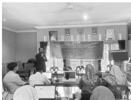
Gambar 2. Pemberian Materi Pelatihan