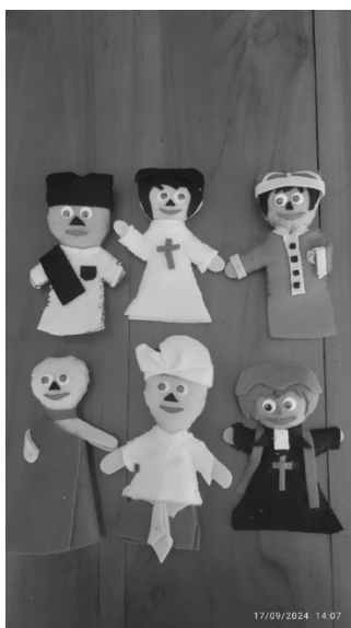
Gambar 3. Produk Boneka Jari Hasil Pelatihan

Dari hasil praktek yang telah dilakukan oleh peserta pengabdian diketahui bahwa semua kelompok mendapatkan hasil yang memuaskan, hal tersebut dilihat dari indikator penilaian yang dilakukan oleh tim pengabdian dimana tidak ada yang mendapatkan kategori kurang. Mayoritas indikator penilaian yang didapatkan adalah baik dan hanya sedikit indikator saja yang mendapatkan cukup. Hal tersebut membuktikan bahwa seluruh peserta pengabdian telah memiliki skill dalam membuat boneka jari agama. Berikut merupakan dokumentasi hasil boneka jari agama yang telah dihasilkan oleh peserta.