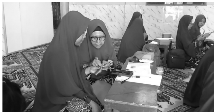
Gambar 1. Dokumentasi Kegiatan Inti

Setelah menjelaskan latar belakang kegiatan lalu dijelaskan pula tentang apa itu boneka jari agama dan tahap cara pembuatannya. Adapun inti dari tahap cara pembuatan boneka jari agama tersebut meliputi (1) mengumpulkan bahan, (2) memotong bahan sesuai pola yang dimulai dari bentuk badan yang disesuaikan dengan ukuran jari guru, (3) mendesain ornament boneka seperti kostum dan (4) menempelkan ornament atau pernak pernik ke boneka yang telah dibuat. Setelah pemaparan materi oleh narasumber, dilanjutkan dengan praktik langsung membuat boneka jari agama oleh peserta pelatihan di damping oleh tim pengabdian. Peserta pelatihan dibagi menjadi 5 kelompok dimana masing-masing kelompok akan membuat 1 desain boneka jari agama sesuai 5 agama yang ada di Indonesia. Setelah boneka jari agama jadi, selanjutnya peserta akan mempresentasikan boneka jari agama yang sudah dibuat di depan. Terakhir, pada acara penutup berisi kegiatan penyerahan cinderamata dan foto bersama yang dilakukan. Berikut adalah dokumentasi kegiatan pengabdian kepada masyarakat yang telah dilakukan.