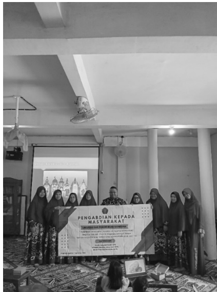
Gambar 2. Dokumentasi Kegiatan Penutup

Dalam pelatihan ini data dikumpulkan dengan dua cara yaitu wawancara dan observasi untuk mengetahui hasil pemahaman dan keterampilan peserta pelatihan tentang pembuatan boneka jari agama setelah kegiatan pelatihan dilaksanakan. Untuk mengetahui evaluasi berjalannya acara pelatihan yang sudah dilakukan maka digunakan instrument observasi ceklist. Berikut hasil yang di dapatkan.